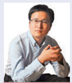
宋清輝 著名經濟學家

近段時間以來，上市公司跨界投資備受市場關注，先是生產紙尿褲的公司豪悅護理跨界炒煤炭期貨虧損上億元，被監管機構警告，後有眾興菌業、吉宏股份以及*ST 寶德「跨界喝酒」失敗。這些 A 股上市公司為何頻頻跨界？