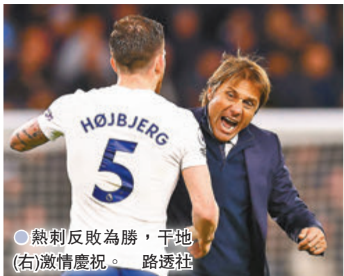
●熱刺反敗為勝，干地(右)激情慶祝。

香港文匯報訊(記者梁志達)本月初才上任的干地在執教的第一個熱刺主場英超比賽中，以2:1逆轉得勝，亦是這位意大利名帥重返英超後的第一場聯賽勝仗。