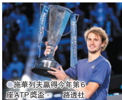
●施華列夫贏得今年第6座ATP獎盃。

東京奧運網球男單金牌得主施華列夫，在拿下本季第6座世界男子網球協會(ATP)巡迴賽單打冠軍後說：「感覺很棒，我擊敗了連贏我5場比賽的對手，抱回ATP年終賽冠軍。我得打出職業生涯數一數二的表現。」賽會3號種子施華列夫此役兩盤各破了今年美國網球公開賽冠軍梅德韋傑夫的發球局1次，全場只花75分鐘就勝出，繼2018年後再次封王。今年ATP年終賽首度由英國倫敦移師意大利都靈舉行，也是2005年以來首次有兩名25歲或以下選手爭冠。