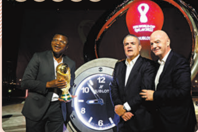
2022卡塔爾世界盃倒數時鐘當地時間21日晚在多哈海濱大道釣魚碼頭亮相，標誌着卡塔爾世盃進入1周年倒數，出席儀式的包括國際足協主席恩芬天奴(右)和法國名宿西里(左)。