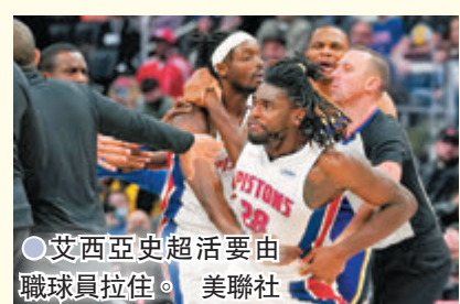
●艾西亞史超活要由職球員拉往。

昨天NBA常規賽，洛杉磯湖人在安東尼戴維斯攻入30分的帶領下，作客以121:116擊敗底特律活塞，但湖人球星勒邦占士在比賽第3節中「開睜」打到活塞的艾西亞史超活眼角流血，後者生氣非常進而引發雙方衝突，兩人也因此被罰離場，這還是勒邦占士NBA生涯第二次被判蓄意犯規而被趕出場。安東尼戴維斯賽後為隊友辯護說：「NBA每個人都知道(占士)不是個打波不君子的人，發生事情當下他也立刻回頭，並表達是他的錯。他不是有意的。」 ●綜合外電