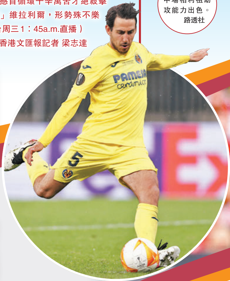
●維拉利爾中場柏利祖助攻能力出色。