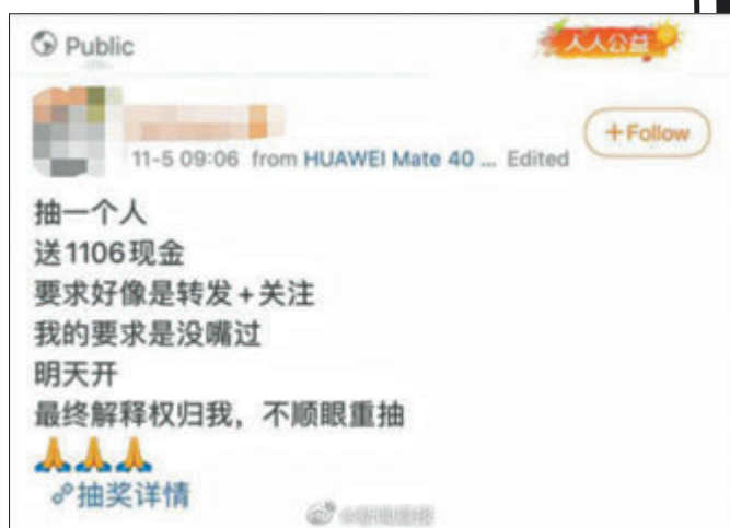
▲吳亦凡粉絲用抽獎為吳亦凡慶生。網上圖片