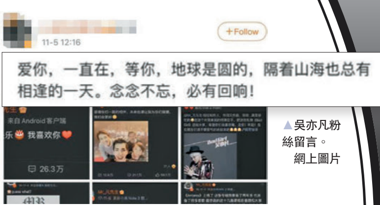
▲吳亦凡粉絲留言。