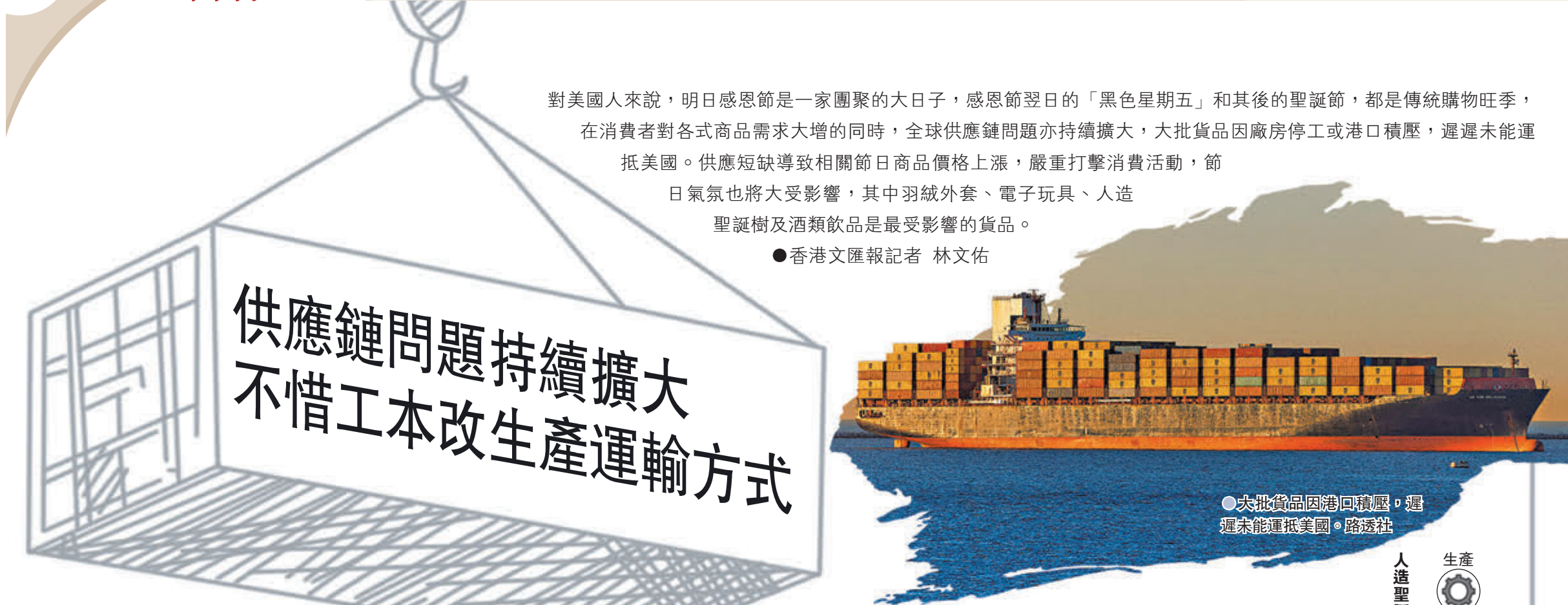
●大批貨品因港回積壓，遲遲未能運抵美國。