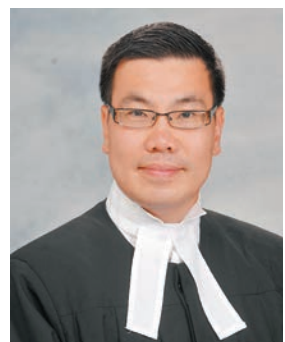
灣仔區域法院法官李慶年。資料圖片