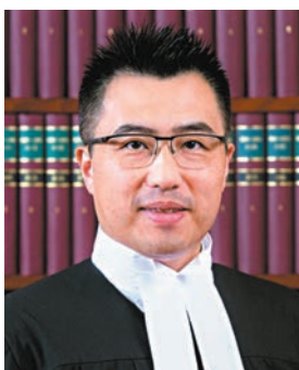
●沙田裁判法院裁判官彭亮廷。

近日，香港高院原訟法庭暫委法官陳仲衡、區域法院法官李慶年、暫委法官張潔宜及裁判官彭亮廷，分別收到內藏「哥士的」（氣氧化鈉，俗稱燒鹼或火鹼）或變質肉醬的信件。為安全起見，部分法院服務一度暫停。