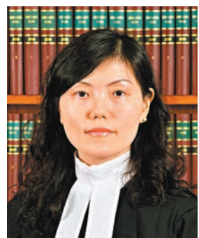
區域法院暫委法官張潔宜。資料圖片