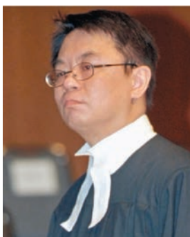
●高等法院原訟法庭暫委法官陳仲衡。資料圖片