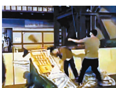
●2019年12月1日晚上，旺角一名清理路障的男市民慘遭暴徒以硬物重擊頭部。資料圖片

香港文匯報訊(記者 葛婷)攪炒派於前年12月1日煽惑九龍區遊行並演變成多區暴動。其間，旺角彌敦道一帶逾百名暴徒非法集結堵路及縱火，警方採取行動拘捕多人，其中4人被控參與非法集結及藏有攻擊性武器罪，案件昨在九龍城裁判法院開審。案中其中一名女被告承認非法集結