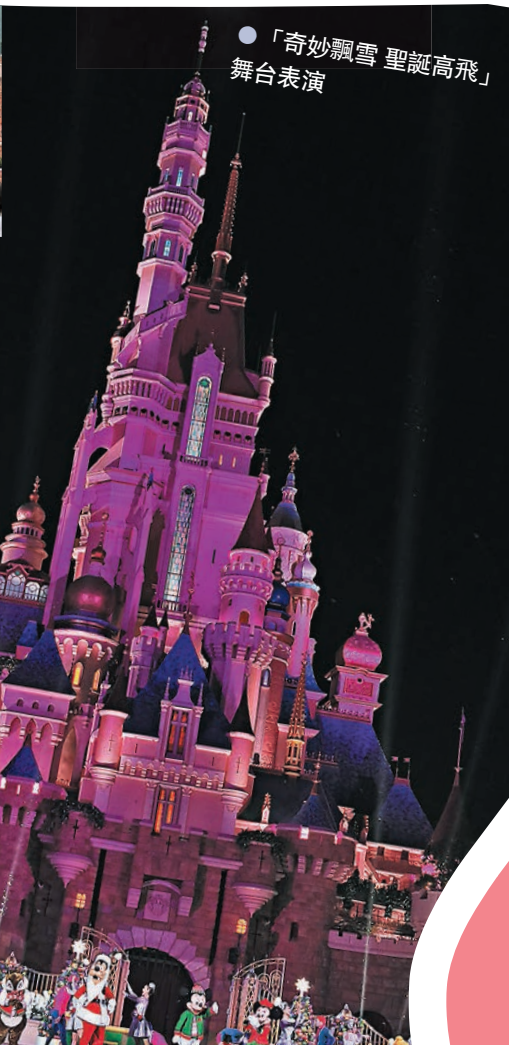
「奇妙飄雪 聖誕高飛」舞台表演