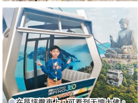
在昂坪纜車上，可看到天壇大佛。

朱古力的香甜令人陶醉，於聖誕節傳統幾乎無處不在，一向致力與不同界別合作創新的昂坪360，今個聖誕就與擁有140年歷史的著名意大利朱古力品牌Venchi，由即日起至明年1月2日，攜手帶來一個充滿意式風情的「甜蜜聖誕」——昂坪360 x Venchi朱古力聖誕嘉年華，在昂坪市集除了有打卡必到的IG-able朱古力聖誕裝置，特設4項充滿歡樂氣氛的遊戲，讓大家可以有機會贏取豐富獎品。而且，於12月24日至26日期間，聖誕老人更將遊走昂坪市集每個角落，沿途派發小禮物，分享快樂，共嚐朱古力的甜蜜。