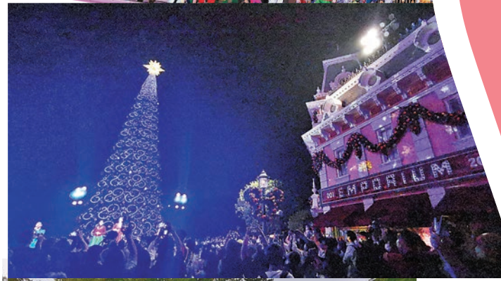
夢想成真聖誕樹亮燈禮