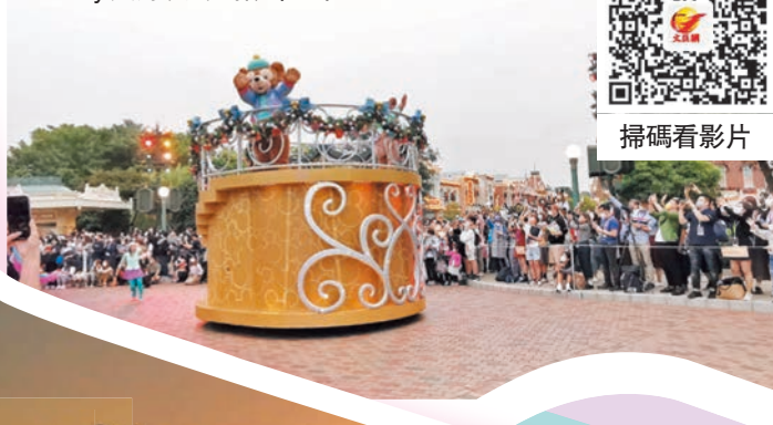
Duffy與好友冬雪歡樂巡禮

在冬日的陽光下，Duffy與好友齊齊換上特色冬日服飾，登上美輪美奐的花車為大家獻上全新「Duffy與好友冬雪歡樂巡禮」。在漫天飄雪下，他們可愛地向在場每一位賓客揮手舞動，笑着分享佳節歡樂。米奇老鼠也會與一眾迪士尼朋友誠邀你出席傳統聖誕活動「米奇與好友聖誕舞會」，在「奇妙夢想城堡」前，以優美聖誕旋律、曼妙歌聲、活力舞姿掀動