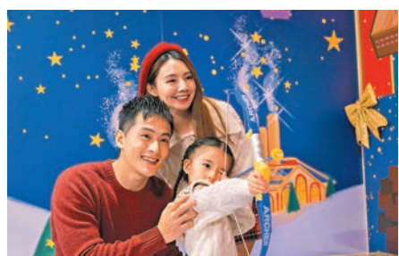
百發百中神射手，讓小朋友感受成為神射手的喜悅。