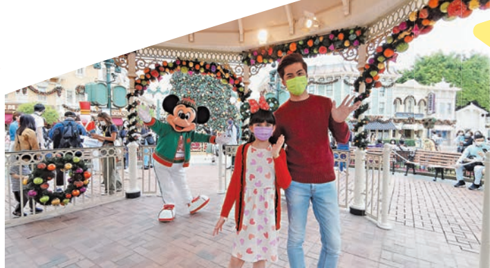
米奇換上聖誕服飾，與遊客合照。