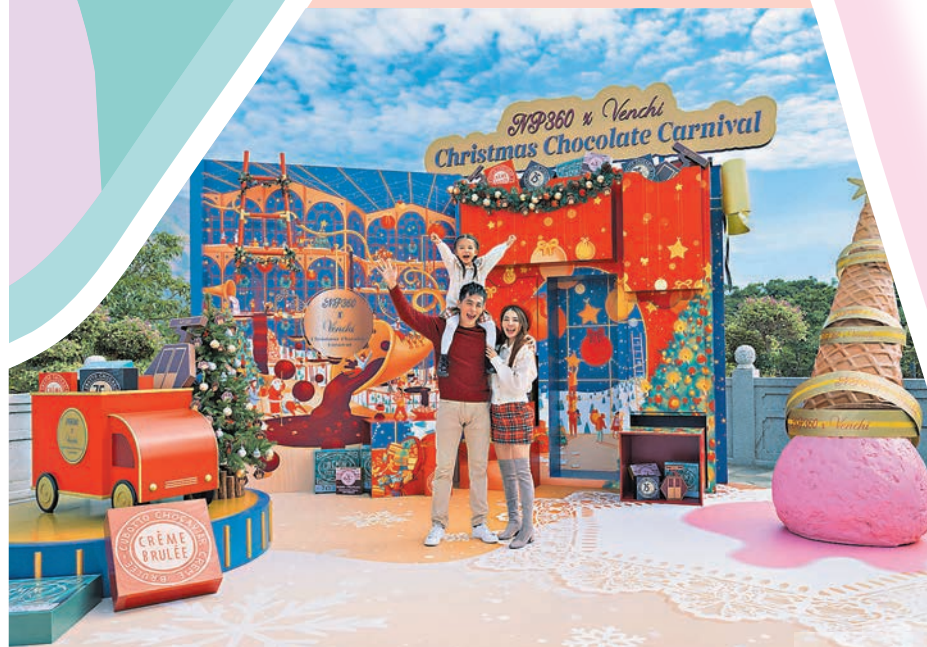
昂坪360 x Venchi 朱古力聖誕嘉年華