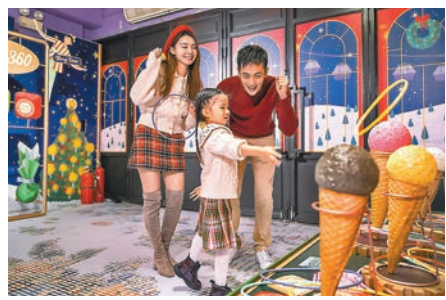
雪糕圈套，玩家只需向雪糕陣投擲膠圈，就有機會贏得精品。