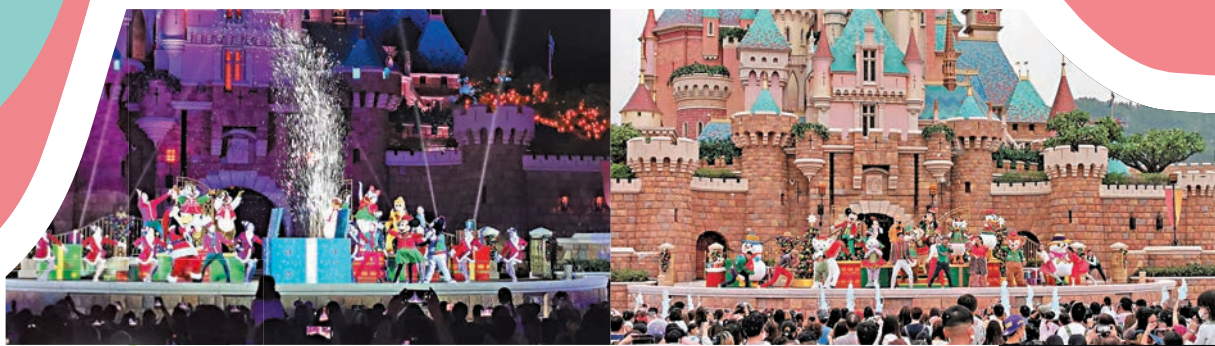
奇妙飄雪 米奇與好友的聖誕舞會