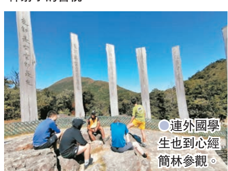
連外國學生也到心經簡林參觀。