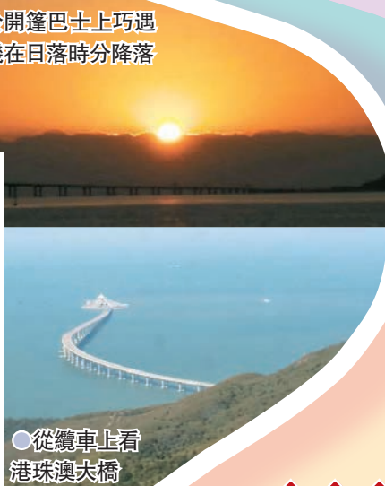
從纜車上看港珠澳大橋