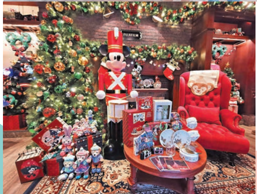
變身聖誕禮物店的馬迪小店