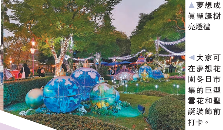
大家可在夢想花園冬日市集的巨型雪花和聖誕裝飾前打卡。