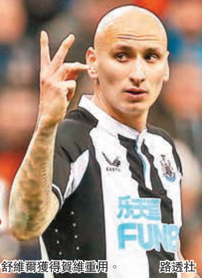
● 舒維爾獲得賀維重用。