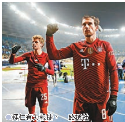
● 拜仁主場報捷。

德甲今晚有免費直播，戲碼為拜仁慕尼黑主場對比勒費爾德(香港開電視77台，有線602及662台周日1:30a.m.直播)。拜仁剛於歐聯擊敗基輔戴拿模，證明球員未有因上周聯賽不敵奧格斯堡而影響士氣，今晚迎戰近8戰得1勝3和4負的比勒費爾德，有力再次全取3分。