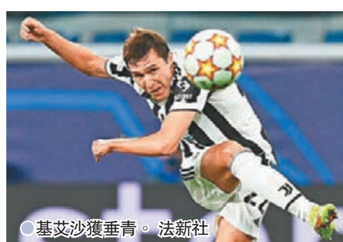
● 基艾沙獲垂青。

同日意甲比賽，祖雲達斯將於主場對阿特蘭大(now638台周日1:00a.m.直播)。祖雲達斯早前於意甲連勝費倫天拿和拉素，聯賽有復甦走勢下今晚有力再下一城。至於國際米蘭在聯賽、歐聯連勝拿玻里和薩克達，作客今輪賽前排名第14位的威尼斯該穩袋3分。(now638台周日3:45a.m.直播)