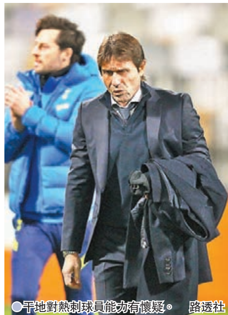
● 干地對熱刺球員能力有懷疑。

亞也只有兩分，球隊仍要待最後一輪比賽後才能確定能否出線歐霸16強。至於韋斯咸同日作客以兩球淨勝維也納迅速，已奠定首名資格直入16強。