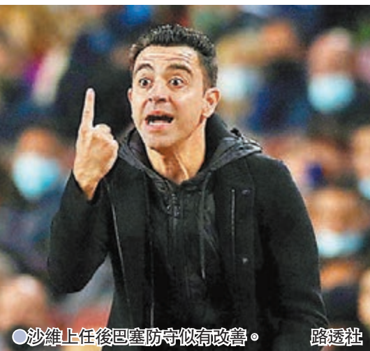
● 沙維上任後巴塞防守似有改善。