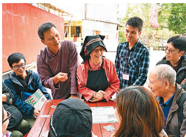
●在荔枝窩項目中，團隊致力擴展村民的網絡和建立他們的能力以復興鄉村社區。