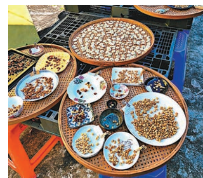
●咖啡豆和薑黃花等作物。