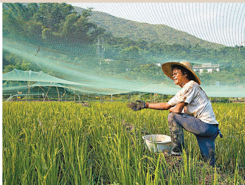
●荔枝窩項目中，透過復耕水稻以保護自然生態和文化，並提供體驗式學習。