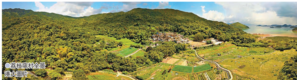
●荔枝窩村全景。