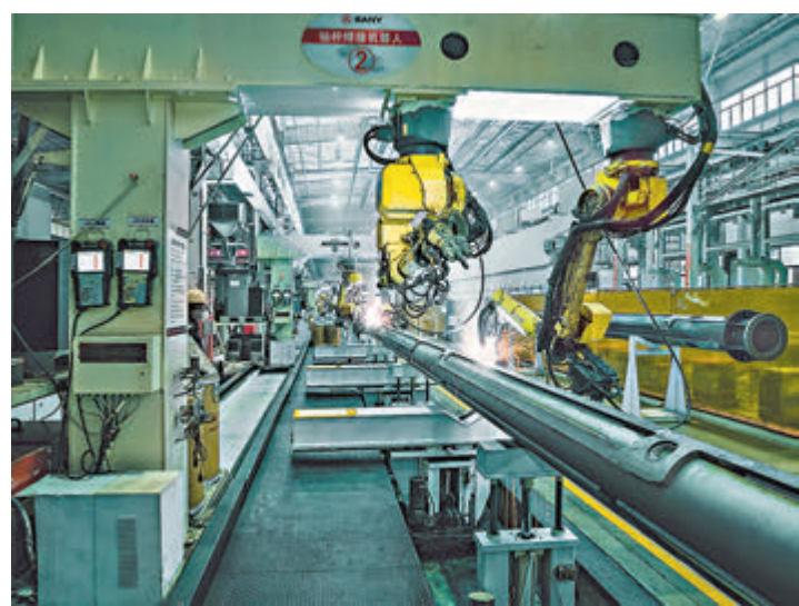
●焊接工作島，機器人替代工人焊接。