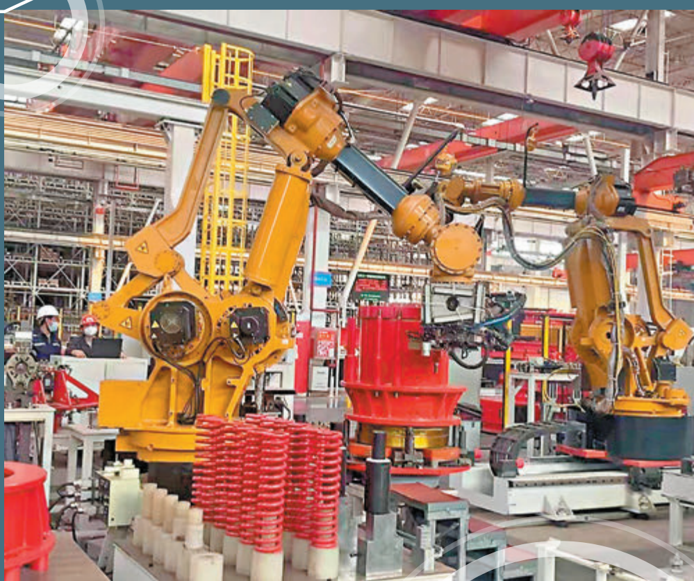
●機器人手臂上搭載5G高清傳感器、AR等設備，幫助其抓取精密零件進行裝配。