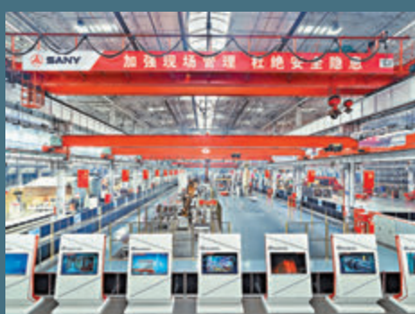
●三一重工北京樁機工廠智能化改造的廠房。