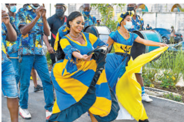
●巴巴多斯即將轉向共和制，當地舉行多場慶祝活動。