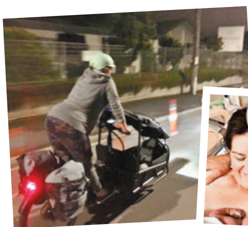
●珍特騎單車奔往醫院。 網上圖片