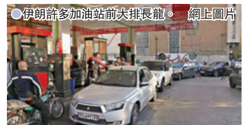
●伊朗許多加油站前排長龍。