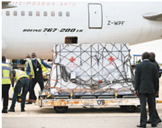
●今年年初中國援助的新冠疫苗運抵津巴布韋。資料圖片

九是和平安全工程。中國將為非洲援助實施10個和平安全領域項目，繼續落實對非盟軍事援助，支持非洲國家自主維護地區安全和反恐努力，開展中非維和部隊聯合訓練、現場培訓、輕小武器管控合作。