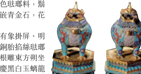
■乾隆 銅鑲胎填珞瓏嵌松石珊瑚青金石角端熏爐一對