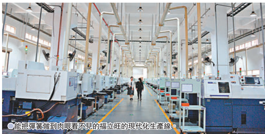
能把彈簧做到肉眼看不見的福立旺的現代化生產線。

貿易戰爆發後，一家美國500強企業曾多次到墨西哥和其他國家考察，試圖尋找能夠替代福立旺的供應商，但是最終發現當地彈簧廠商無論是生產效率還是產品品質都比不上福立旺。最終這家企業在美國加稅的情況下，反而大幅增加了在福立旺的訂單。