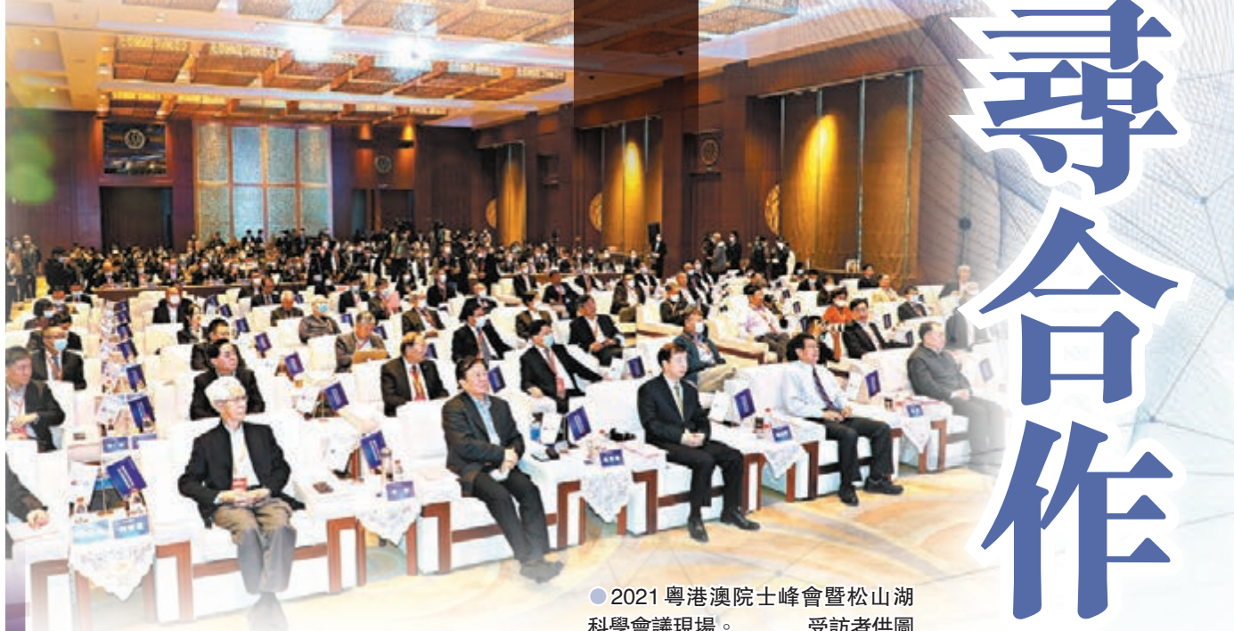
● 2021粵港澳院士峰會暨松山湖科學會議現場。