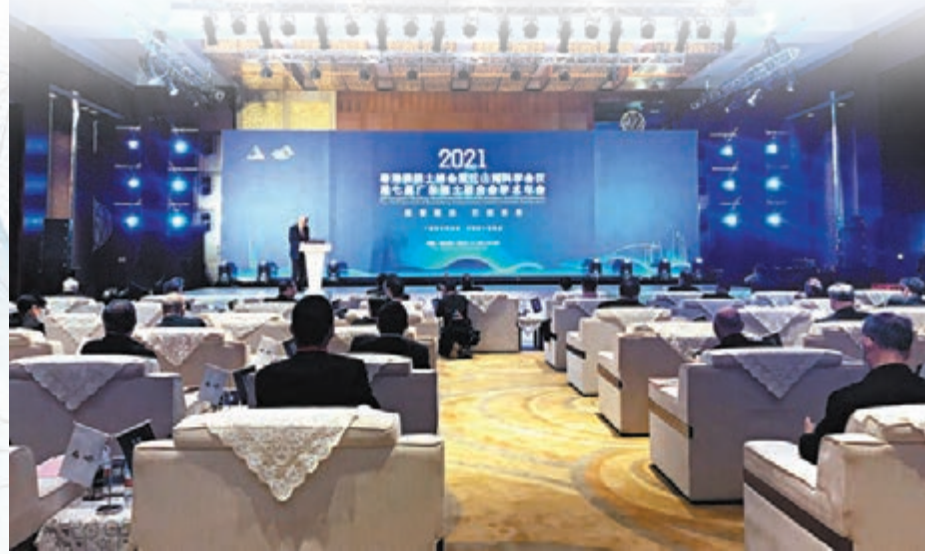
● 2021粵港澳院士峰會暨松山湖科學會議全體大會1日在東莞松山湖舉行。

梁振英認為,由廣東院士聯合會牽頭主辦的粵港澳院士峰會在院士專家中形成了廣泛的影響,為海內外院士走進大灣區、認識大灣區、建設大灣區搭建了平台,必將有利於進一步深化粵港澳及海外院士專家的合作交流,推動粵港澳科技創新融合發展,為建設國際創科新中心和國際一流灣區貢獻創科力量。