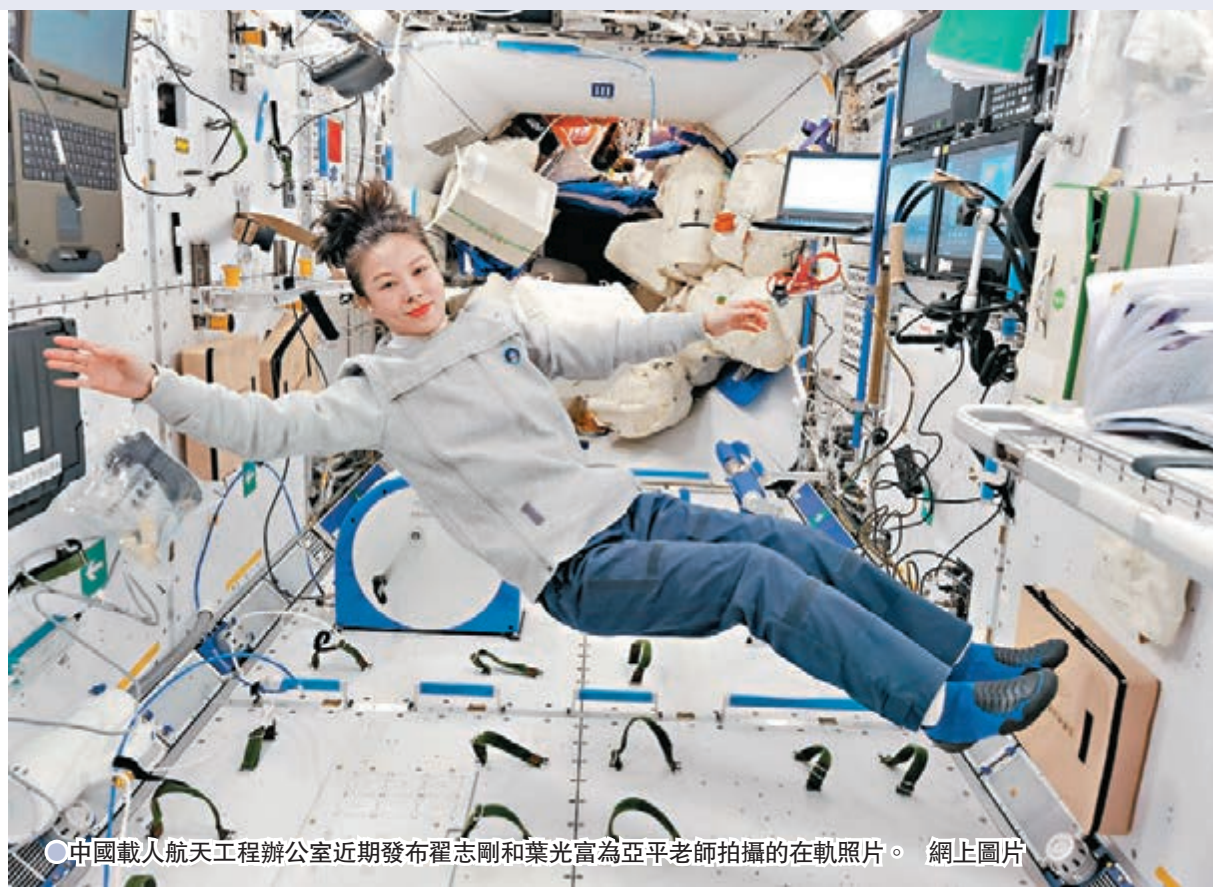
●中國載人航天工程辦公室近期發布翟志剛和葉光富為亞平老師拍攝的在軌照片。網上圖片

此次太空課堂的「教室」，從並不寬敞的天宮實驗室升級成為「太空別墅」級別的天宮太空站，授課的內容預計將更加豐富、有趣。官方亦強調，「天宮課堂」是會成為長期運營的科普品牌，將結合載人飛行任務，貫穿中國太空站建造和在軌運營系列化推出，授課將由中國航天员擔任「太空教師」，以青少年為主要對象，採取天地協同互動方式開展。