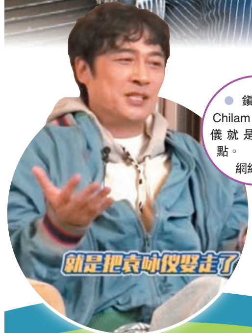
● 鎮宇說 Chilam 娶走袁詠儀就是他的優點。 網絡截圖