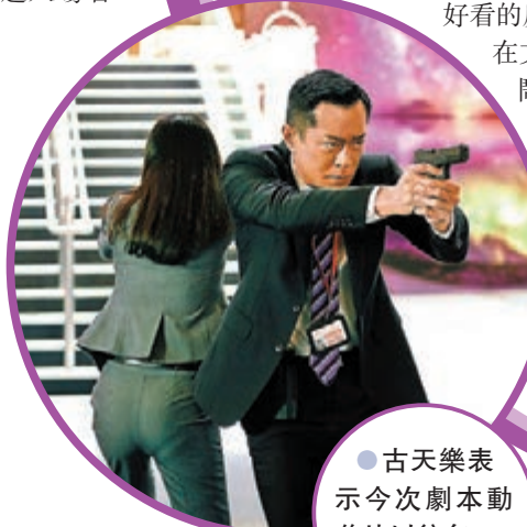
● 古天樂表示今次劇本動作比以往多。