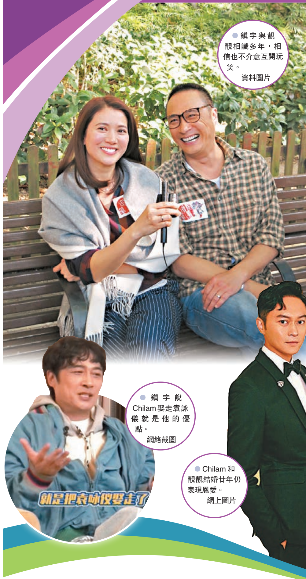
● 鎮宇與靚靚相識多年，相信也不介意互開玩笑。 資料圖片