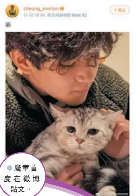
● 魔童首度在微薄貼文。

髮，睫毛纖長濃密、鼻樑高挺，勁似混血兒，網友們紛紛大讚「也太帥了吧」、「眼睛和爸爸好像」，更有人指第一眼看魔童覺得很像韓國防彈少年團靚仔成員 V！