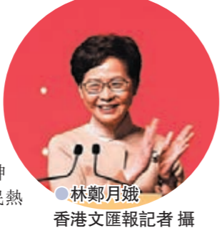
林鄭月娥

正軌，迎來了良好的局面。現在，香港更有條件加強與內地人在各方面的交流，而中央對此也是大力支持，早前一系列「時代精神耀香江」的活動，受到市民熱烈歡迎。 助港更好融入國家發展大局 林鄭月娥強調，這次內地奧運健兒訪港，再次體現了中央對香港的關愛，肯定有助推動香港更好融入國家發展大局，以及加強香港市民對國家的認同感和自豪感。 她續說，香港社會的體育氛圍比過去更為熾熱，很多市民在十多天的奧運賽事中除了為香港運動員打氣外，也同時緊貼內地運動員的賽事，對內地的運動員也很熟悉，也感到很親切，所以對他們是次訪港感到特別興奮。今天3場公開活動的門票更是「一票難求」，未能入場的市民仍可通過電視直播欣賞運動員的體育示範和精彩演出。 林鄭月娥表示，香港市民對國家運動員感到特別親切，香港的運動員和內地運動員的聯繫都比過去更為緊密。東奧期間，頒獎儀式後，國家乒協主席劉國梁主動邀請香港運動員與國家運動員一起拿着國旗和區旗合影，香港運動員都感到很高興，這張人們稱為「勝利會師」的合照引起了很大的迴響，是兩地運動員既是對手、又是朋友的最佳寫照。