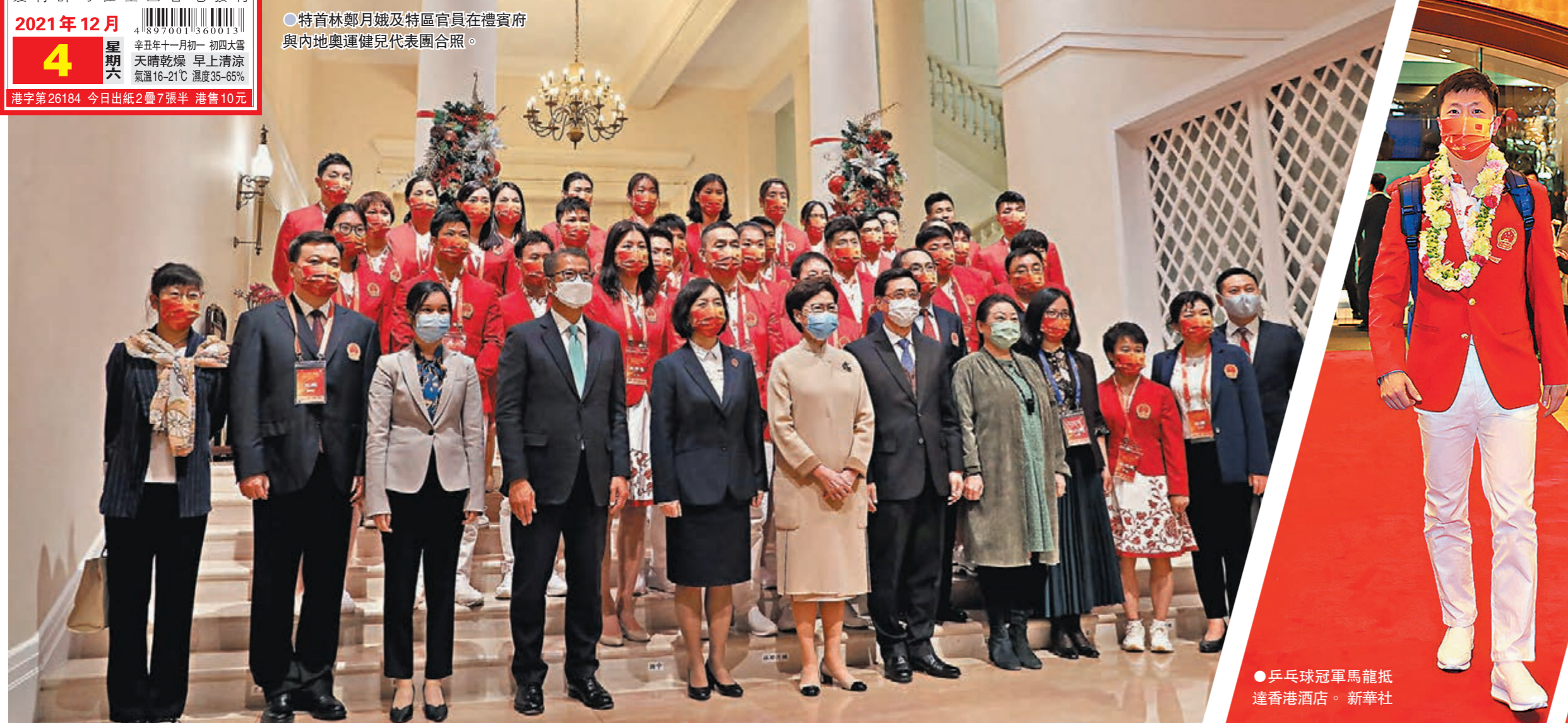
●特首林鄭月娥及特區官員在禮賓府與內地奧運健兒代表團合照。