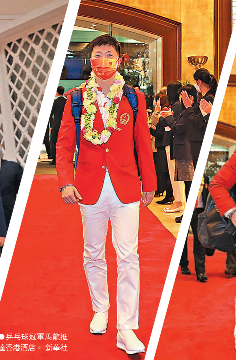
●乒乓球冠軍馬龍抵達香港酒店。