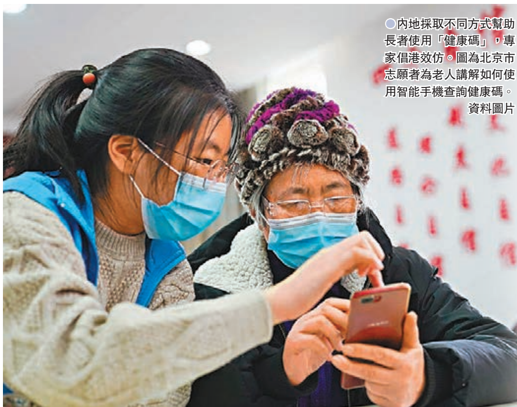
●內地採取不同方式幫助長者使用「健康碼」，專家倡港效仿。圖為北京市志願者為老人講解如何使用智能手機查詢健康碼。資料圖片