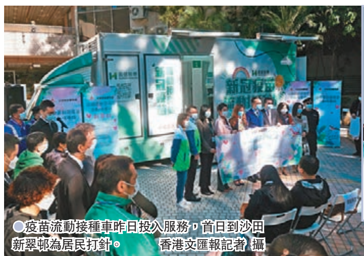
●疫苗流動接種車昨日投入服務，首日到沙田新翠邨為居民打針。