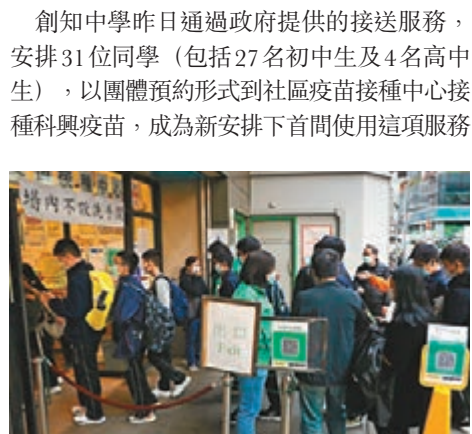
●創知中學31名學生昨日前往官涌疫苗接種中心接種科興疫苗。

創知中學昨日通過政府提供的接送服務，安排31位同學(包括27名初中生及4名高中生)，以團體預約形式到社區疫苗接種中心接種科興疫苗，成為新安排下首間使用這項服務