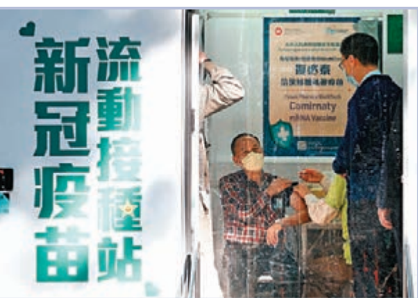
●昨日有不少長者即場「上車」接種，均表示疫苗接種車十分方便。

香港文匯報訊(記者張弦)香港「健康碼」計劃出爐，意味香港與內地恢復正常通關的條件更成熟，刺激打算免檢疫返內地的市民踴躍接種疫苗。為加強疫苗接種率，特區政府的新冠疫苗流動接種車昨日首日投入服務，反應熱烈，大批市民排長龍輪候接種復必泰疫苗，承辦商預留的300針險些不夠用。有長者表示：「之前女兒唔贊成我打針，但我說一定要打，怕唔打返唔到深圳。」也有長者表示，流動接種車安排方便，「之前無打，因為疫苗中心太遠，現在落樓就有得打，又唔使網上預約，非常方便。」