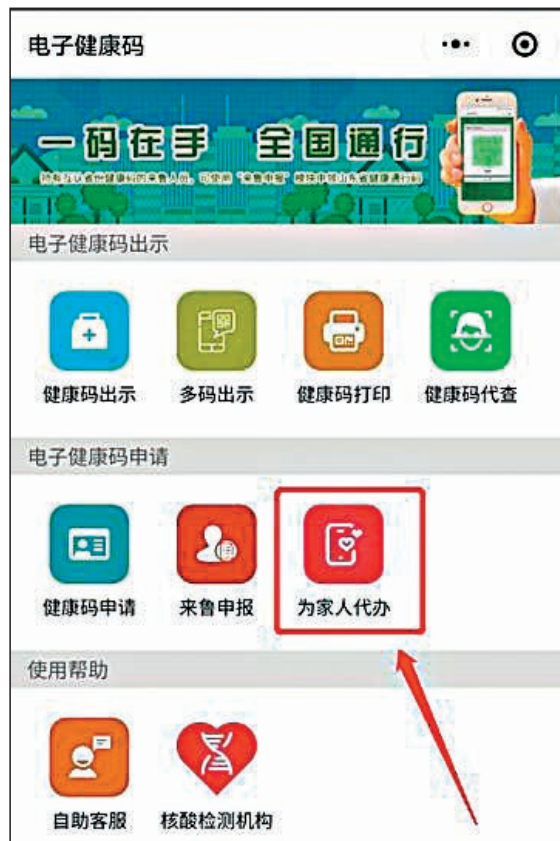
▲內地不會使用智能手機的長者可由家人代辦「健康碼」，或者使用離線截圖。網上截圖

薛永恒表示，「安心出行」下載量已逾694萬人次，獲市民廣泛認同和使用，利用「安心出行」上載行蹤申請「港康碼」，是最有效方法。他強調使用智能手機申請「港康碼」很必須，因為回內地對接「粵康碼」亦必須使用智能手機。