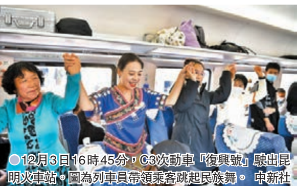
12月3日16時45分，C3次動車「復興號」駛出昆明火車站。圖為列車員帶領乘客踴躍起民族舞。中新社