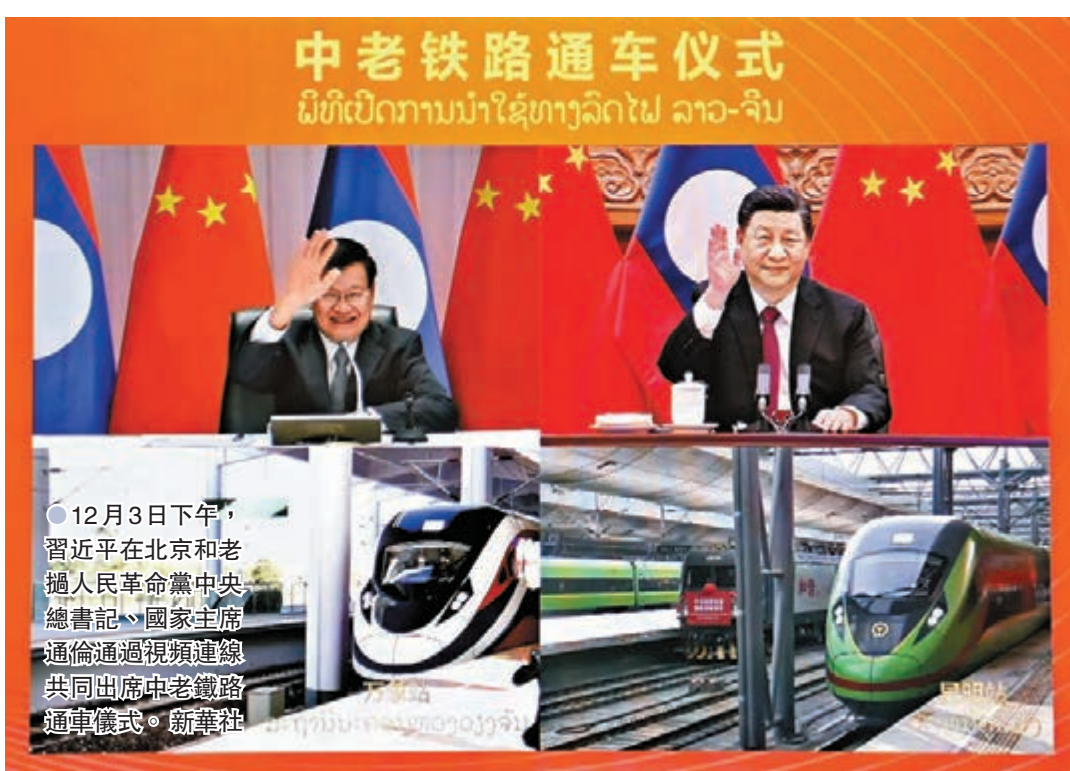
12月3日下午，習近平在北京和老撾人民革命黨中央總書記、國家主席通倫通過視頻連線共同出席中老鐵路通車儀式。

中老鐵路是高質量共建「一帶一路」的標誌性工程。近年來，中方以高標準、可持續、惠民生為目標，不斷提升共建「一帶一路」水平，實現了共建國家的互利共贏，為世界經濟發展開闢了新空間。中方願同老撾等沿線國家一道，加快打造更加緊密的「一帶一路」夥伴關係，共同推動構建人類命運共同體。