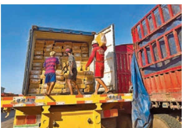
700餘噸橡膠3日下午從萬象出發運往昆明。