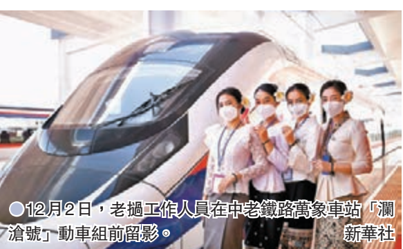
12月2日，老撾工作人員在中老鐵路萬象車站「瀾滄號」動車組前留影。