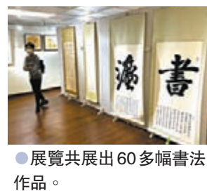
● 展覽共展出60多幅書法作品。