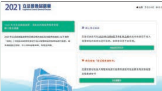
● 選民從內地返港投票安排網上登記系統的頁面。

一張小小的選票，甚至禁不起風吹雨打；可你一筆，我一筆，就在每個香港人的決定中，它可以爆發出千鈞的分