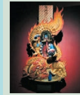
● 陸揚、高橋直孝 《電磁腦神教之火神》