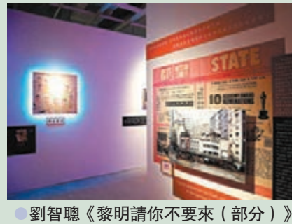
● 劉智聰《黎明請你不要來（部分）》