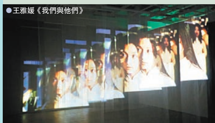
● 王雅媛《我們與他們》