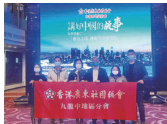
▲九龍中地區分會首長與嘉賓合影。