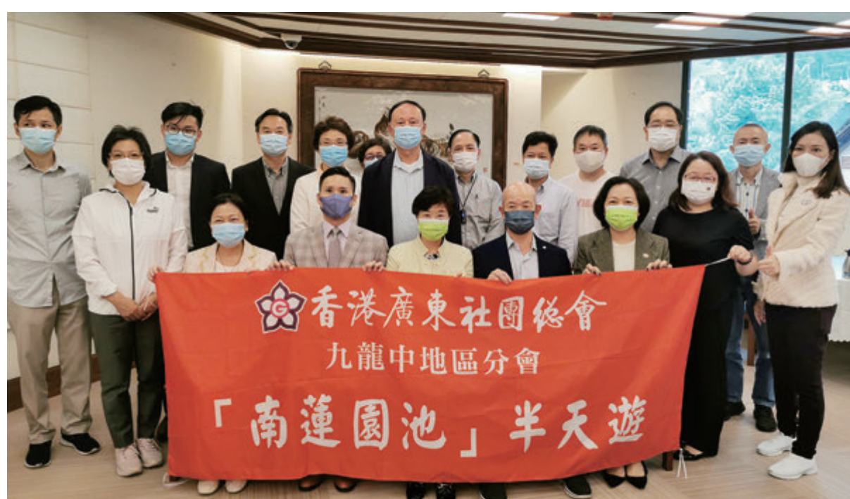
▲廣總九龍中地區分會「講好中國的故事」首場活動於2021年10月下旬在鑽石山南蓮園池舉行。