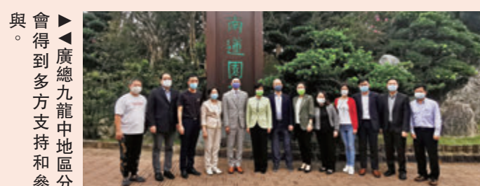
▲廣總九龍中地區分會得到多方支持和參與。

國家「十四五」規劃支持香港發展中外文化藝術交流中心，其中廣總九龍中地區分會參觀的「南蓮園池」已與「志蓮淨苑」一同列入《中國世界文化遺產預備名單》。適逢《山西佛教彩塑回顧展》目前正在南蓮園池香海軒展廳展出，此次展出的大量高品質攝影作品，全部是上世紀80年代初「志蓮淨苑」為了弘揚祖國佛教雕塑藝術遺產，從山西全境眾多古代寺院選擇15座較優者拍攝而成，可讓香港人感受到中國傳統藝術的強大生命力。