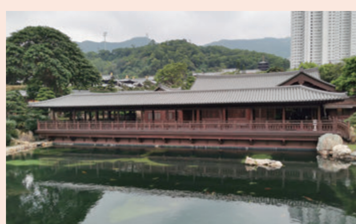
▲「南蓮園池」已列入《中國世界文化遺產預備名單》，亦是香港目前唯一被列入此名單的項目。