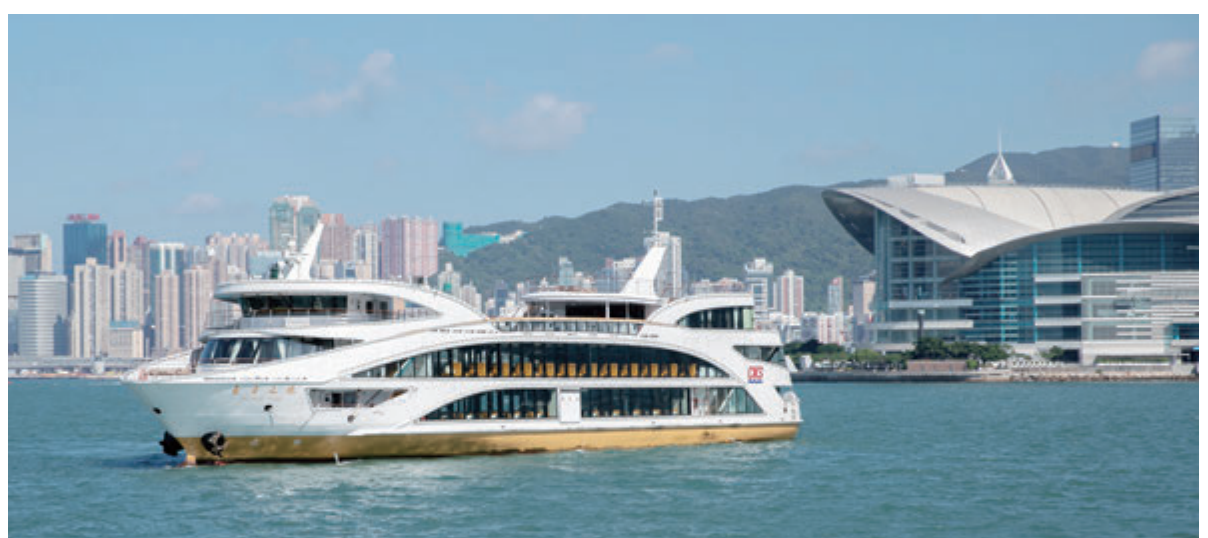
▲維港兩岸醉人美景。

另一場「講好中國的故事」活動於2021年11月上旬舉辦。廣總九龍中地區分會逾200位會員參加「東方之