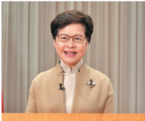
●林鄭月娥呼籲已登記選民在12月19日踴躍投票，為香港開創未來。

全國政協副主席、國務院港澳事務辦公室主任夏寶龍繼早前講述「愛國者治港」的重要原則後，昨日再向香港社會論述新選舉制度的四個優勢和特點。香港特區行政長官林鄭月娥昨日發出聲明，衷心感謝夏寶龍發表講話，並指完善選舉制度就是要落實「愛國者治港」這根本原則，確保立法會議員均為愛國愛港及以國家發展利益和香港長期繁榮穩定為依歸的人士。林鄭月娥與特區政府多名司局長均呼籲市民把握今次立法會選舉，選出賢能之士建設香港美好未來，為中華民族偉大復興作出貢獻。