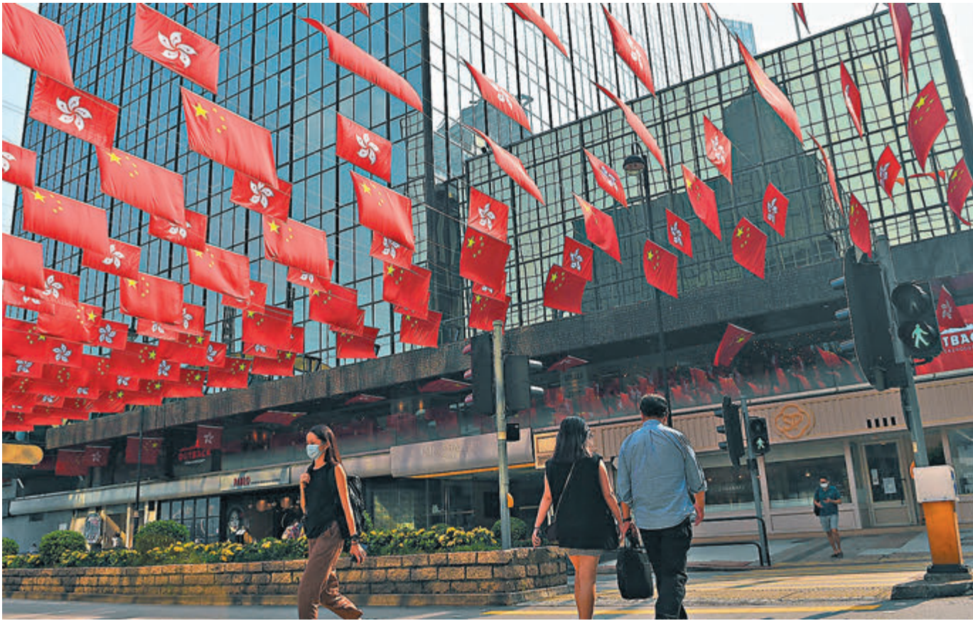
●林鄭月娥昨日發出聲明，衷心感謝夏寶龍發表講話，並指完善選舉制度就是要落實「愛國者治港」這根本原則。圖為今年9月底，逾百面國旗區旗高懸在尖東街頭，迎接國慶節。