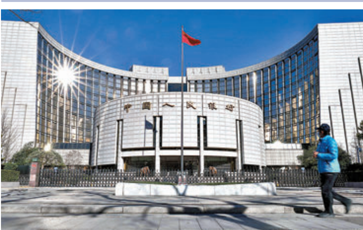
●人民銀行昨日宣佈於12月15日下調金融機構存款準備金率0.5個百分點，並強調穩健貨幣政策取向沒有改變。