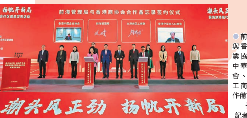
●前海管理局與香港中國企業協會、香港中華出入口商會、全港各區工商聯簽訂合作備忘錄。

通過合作項目，前海交換中心將引入香港電訊在信息通信領域的行業服務模式，進一步提升前海交換中心為內地涉港企業的服務水平，可以更好地落實《粵港澳大灣區發展規劃綱要》，為未來粵港澳大灣區信息基礎設施互聯互通和產業融合探索新道路。接下來，雙方計劃在商業服務、技術環境創新等方面開展合作交流，提升前海交換中心的業務服務能力，助力香港企業在前海享受「港式」服務，為香港企業在前海的發展注入新動能，提供新機遇。