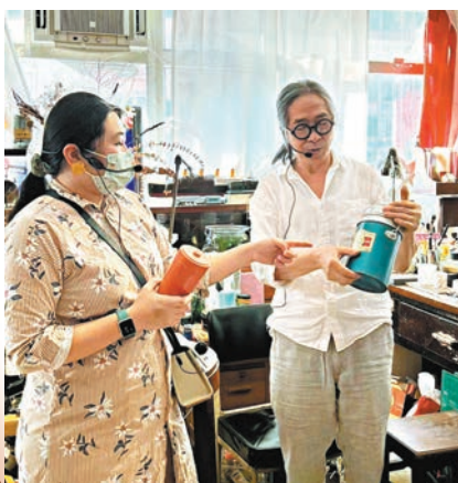
●懷舊水壺是舊區的獨特物件。