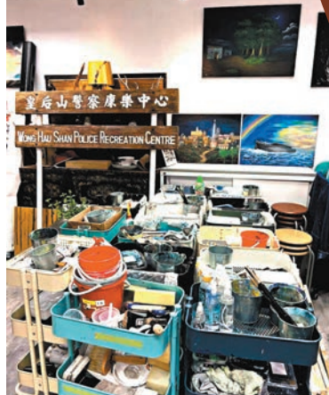
●Y'S Concept Ltd.——介紹公司背景、手繪壁畫示範及手繪workshop。

去取捨。不過，這在歷史上是必然會發生的事情。作為設計中心來說，我們要考慮的是怎麼樣去促使這件事做得更有美感，更加變成一件可以持續的事情。」