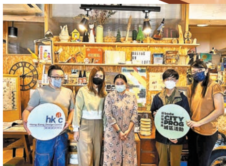
●「樂在製造」擔當社區中的聯繫者，介紹社區中有着不同活動往來的「歌腳點」。