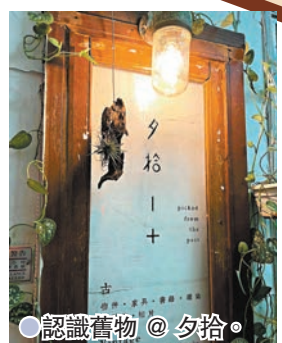
●認清舊物 @ 夕裕。