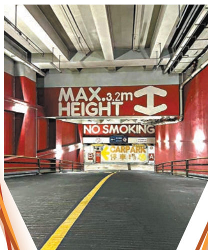
●美華工業大廈的停車場是英雄本色拍攝場地。