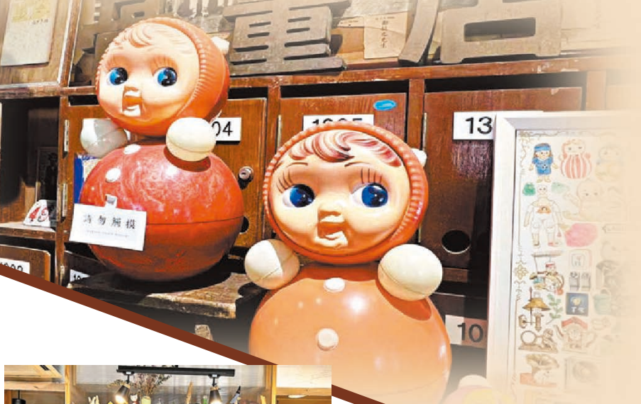
●舊區中的舊物更吸引遊客的興趣。