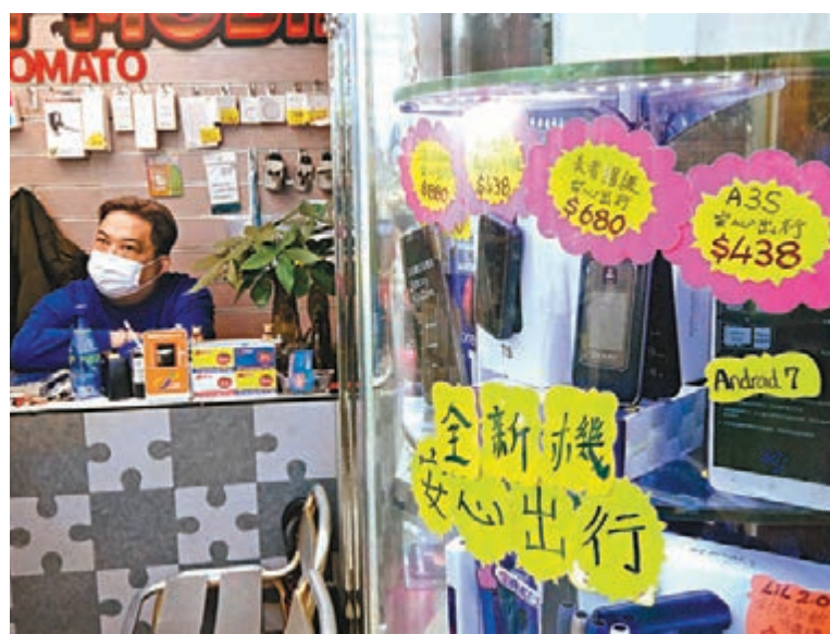
●倫先生的店內有多款低規格電話。

香港文匯報訊（記者 邵昕）今日起進入所有食肆及表列處所必須掃描「安心碼」，只有3類人士獲豁免，坊間隨即湧現一批專門掃「安心碼」的手機，以低價作賣點，生意火爆，一度斷市。香港文匯報記者昨日巡查旺角多間手機賣場，不少商舖的當眼處也有「安心手機」宣傳海報，不時有市民詢問和購買。有年長購買者表示，沿用的手機並非智能手機，因新規定下出入食肆需掃碼，遂決定選購。