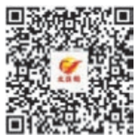
掃碼聯立選 候選人名單