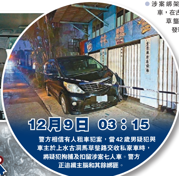
●涉案綁架用賊車，在古洞馬草壟村被發現。