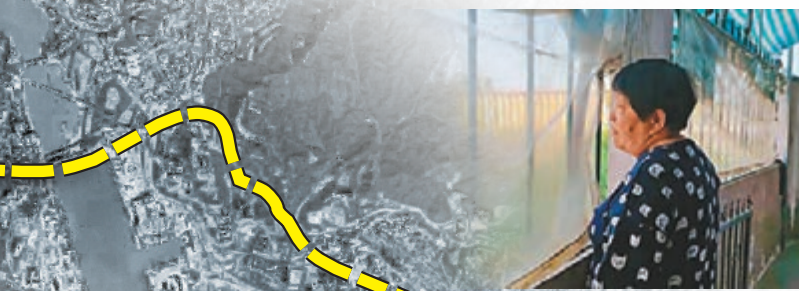
●大窩村村民何女士聽見菲傭求救，並目擊綁匪逃離。