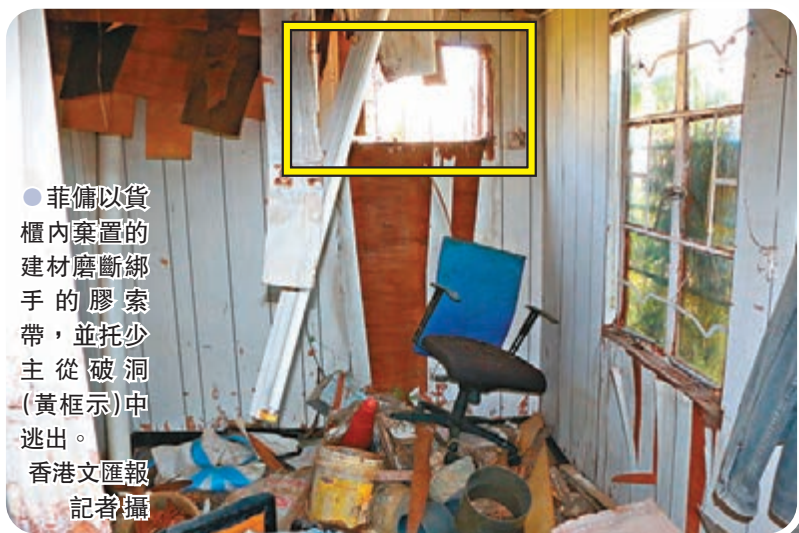
●菲傭以貨櫃內棄置的建材磨斷綁手的膠索帶，並托少主從破洞(黃框示)中逃出。

獲救的39歲菲傭據悉於今年初來港，半年前受僱貝沙灣一名經營連鎖壽司店的日籍東主，負責照顧東主19個月大的女兒日常起居。據悉，該菲傭每天上午徒步護送少主返幼稚園，不排除被人洞悉作息時間及返學路線，中途擄人。由於菲傭在案中力護少主，獲僱主讚揚和感謝。