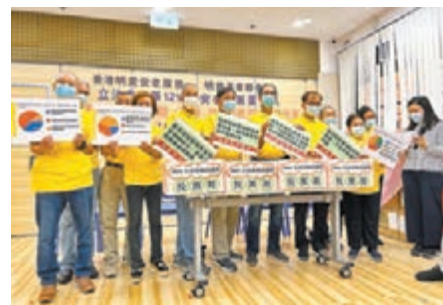
●明愛長者聯會調查顯示，逾半受訪長者關注政府安老院舍的輪候時間，普遍希望輪候不要超過兩年。

香港理工大學應用生物及化學科技學系助理教授梁敬池，以如同洗潔精般同時具備親脂性和親水性的「兩親分子」為基礎，透過人工合成令其可以在光的照射下活動，進而將之組成仿生的軟體驅動器，化作「超分子機器人」系統，希望能成為易於控制、生物應用性廣泛的未來材料。他日前憑此獲頒「表槎前瞻科研大獎」及500萬元資助，以支持其未來5年的研究工作。