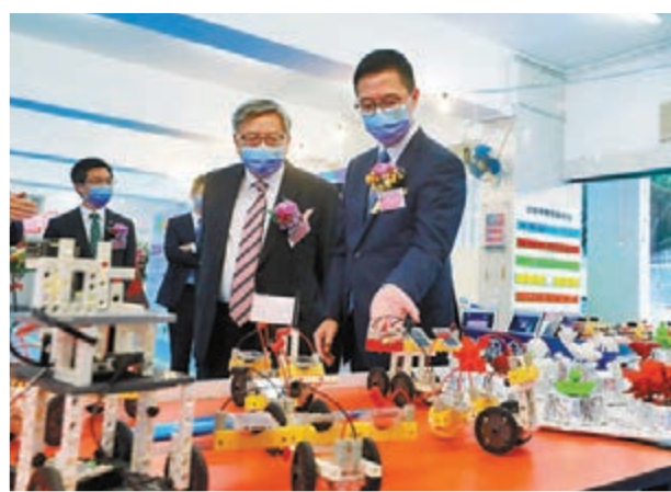
楊潤雄 (右) 參觀學校的科技創新教育展覽。

香港文匯報訊 (記者 姬文風) 香港教育工作者聯會黃楚標學校昨日舉行20周年校慶典禮暨AR浮雕壁畫揭幕禮。主禮嘉賓、教育局局長楊潤雄在致辭時表示，國安教育和國民教育一脈相承，讓學生認識國家各方面發展，培養國家觀念，一向是學校教育的應有之責，高興見到黃楚標學校在推行國民教育上不遺餘力，亦致力為學生建立正面價值觀。他強調，國家明確支持香港發展成為國際創科中心，教育局致力推動資訊科技及STEM教育，樂見學校提供良好環境予學生進行創科活動。