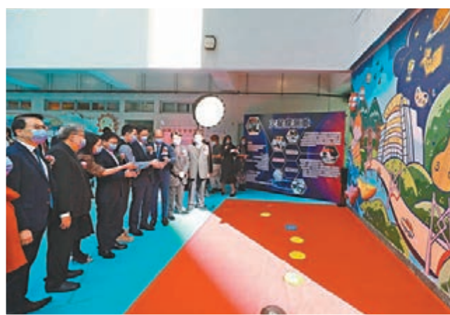
香港教育工作者聯會黃楚標學校昨日舉行20周年校慶典禮暨AR浮雕壁畫揭幕禮。