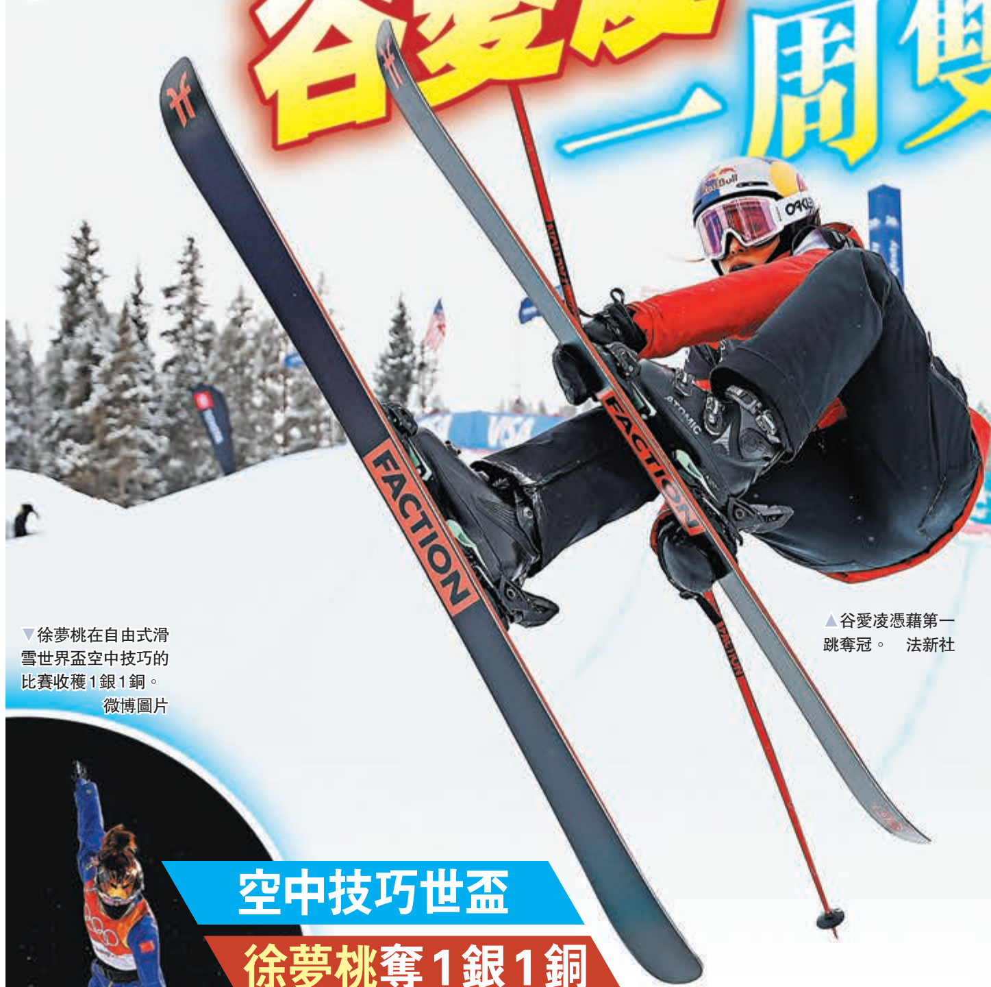
▲ 谷愛凌憑藉第一跳奪冠。

香港時間11日，在2021-2022賽季自由式滑雪U型場地世界盃美國銅山站比賽中，中國選手谷愛凌憑藉第一跳90.50分的高分奪得女子組冠軍，這是在奧運賽季收穫的第二個世界盃冠軍，也是一周內的第二冠。