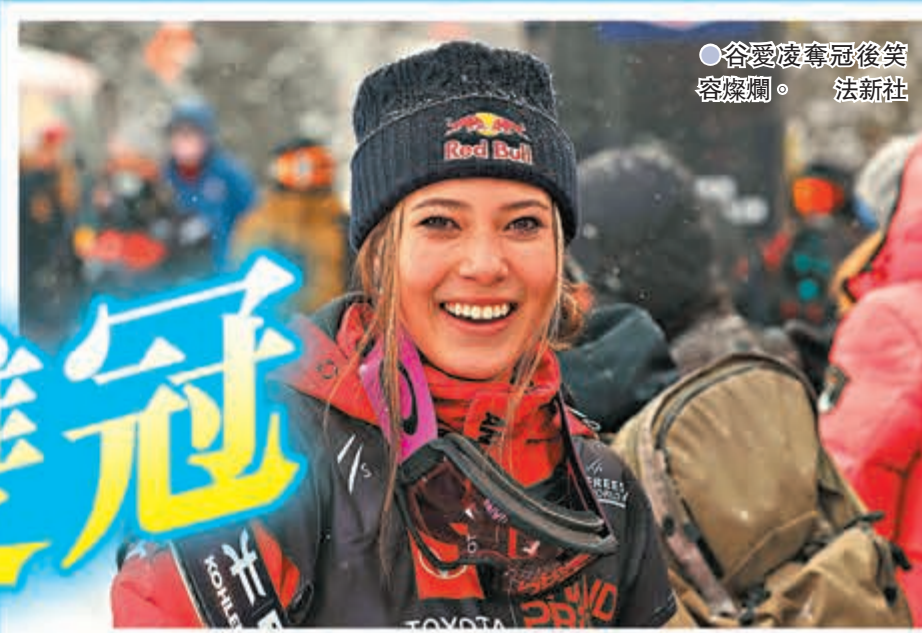
● 谷愛凌奪冠後笑容燦爛。

香港時間11日，在2021-2022賽季自由式滑雪U型場地世界盃美國銅山站比賽中，中國選手谷愛凌憑藉第一跳90.50分的高分奪得女子組冠軍，這是在奧運賽季收穫的第二個世界盃冠軍，也是一周內的第二冠。