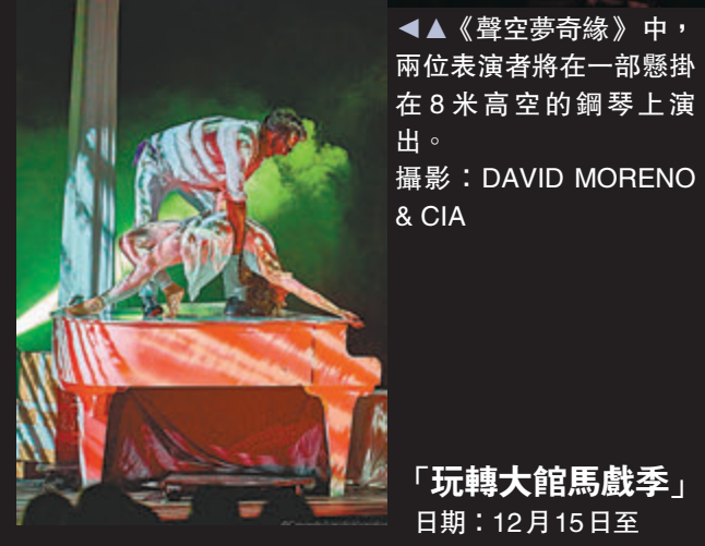
◀▶ 《聲空夢奇緣》中，兩位表演者將在一部懸掛在8米高空的鋼琴上演出。

「玩轉大館馬戲季」日期：12月15日至2022年1月2日 地點：大館各處 各節目具體詳情請參考： https://www.taikwun.hk/zh/programme/detail/tai-kwun-circus-plays/893