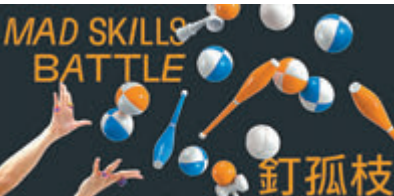
● 《釘孤枝熱血大亂鬥》