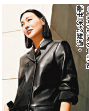
●惠英紅對涂們突然離世深感難過。

岸一家親」。昨日涂們離世的消息傳出，惠英紅連發兩條博文悼念，「不敢相信，難以接受」、「我情願相信，老獸只是睡着了」。