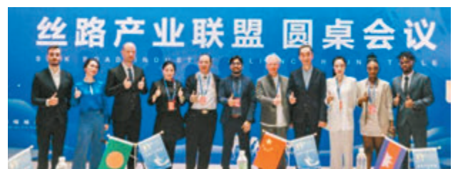
●絲綢之路國際電影節(福州)前日舉行絲路產業聯盟圓桌會議。

絲綢之路國際電影節絲路產業聯盟是一個聚集「一帶一路」沿線國家，開展聯盟簽約、政策發布、成果簽約的電影人交流互動平台。該聯盟負責人表示，鼓勵中國與海內外之間的電影文化交流，促進「絲路」沿線國家電影的交流合作，帶動「一帶一路」沿線國家電影產業項目的落地。