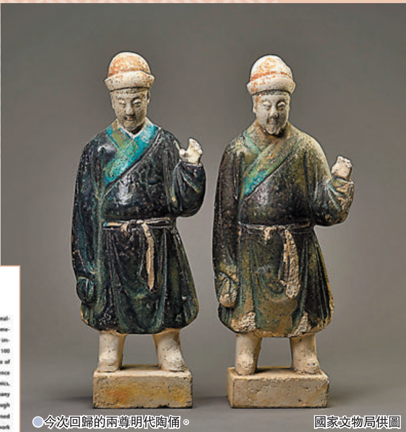
● 今次回歸的兩尊明代陶俑。

一。古代官員出行,有一套嚴整的儀式,且不同等級的官員隨行儀仗也有嚴格的區別。在明代,最高等級的帝王出行儀仗一般稱為「鹵簿」。《大明會典》中對於帝王、皇太子、親王、郡王等儀仗內容及數量都有具體規定。 這套彩色釉儀仗俑隊包含人物俑、騎馬俑和儀仗隊所需要各色人等,還有部分禮儀和生活用品。有施釉和彩繪兩種,在製成的陶俑或其它物品上,施以鉛釉,在600-900度低溫燒造完成以後,有的還在重要部位進行彩繪。儀仗俑隊的排列有較嚴格的安排,4名身穿鎧甲的騎馬武士在前開道,3名鼓吹手緊隨其後。騎馬武士俑後面,跟着眾多文俑和樂俑,其後是8名轎夫所抬大轎,這是整個儀仗隊的核心區域,八人大轎是墓主人所用。其後還有眾多陶俑,簇擁着小