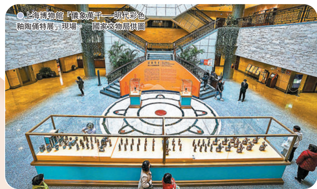
● 上海博物館「儀象萬千——明代彩色釉陶俑特展」現場。

關強表示,中共十八大以來,中國流失文物追索返還工作取得突破性進展。此次蘇珊娜女士將陶俑送歸故土的義舉,展現了令人欽佩的崇高品格,展現了美國普通民眾對中國人民的友好情誼,彰顯了回歸文物所蘊含的「藝術的真正價值」,表達了各國人民攜手保護人類文化遺產的共同心願,必將帶動更多社會各界人士關注和支持文物追索返還工作,促成更多流失文物回家。中國願和國際社會一道,共同守護人類文明成果,促進文明交流互鑒,為踐行人類命運共同體理念不懈努力。