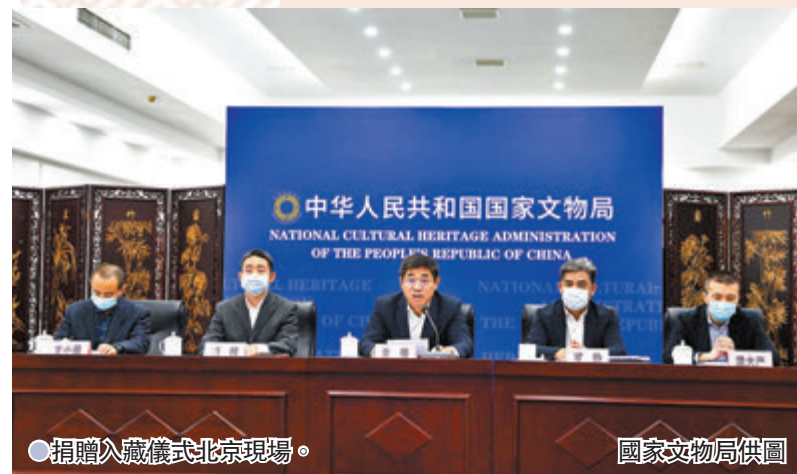
● 捐贈入藏儀式北京現場。