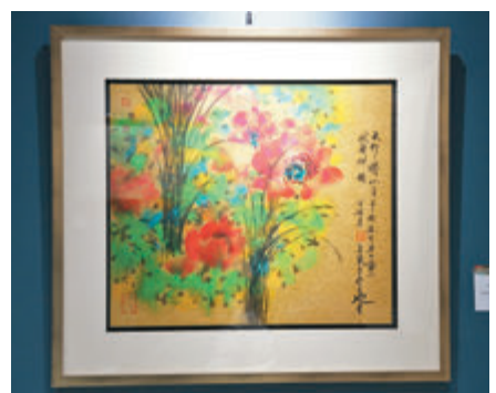
●林天行作品《天行之荷》。