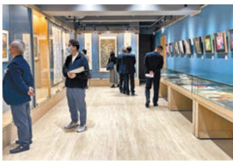
●展覽現場氣氛熱烈。