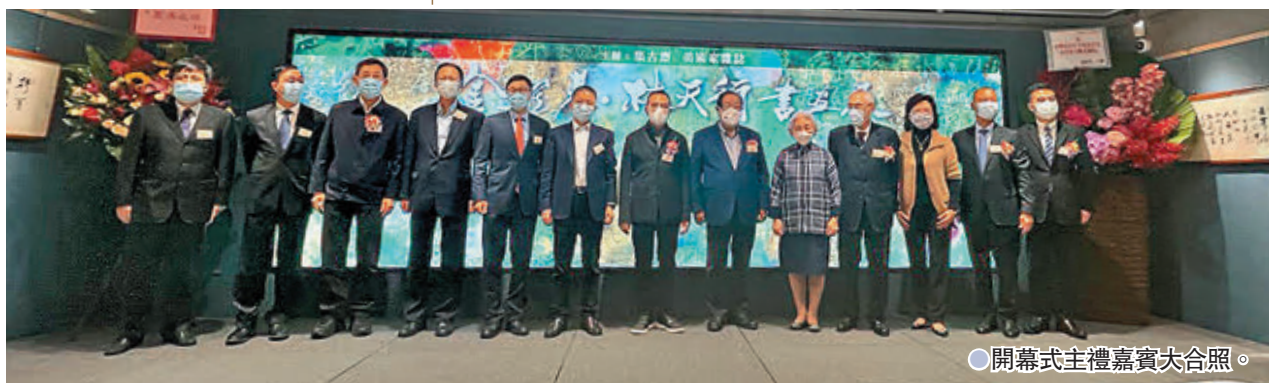
●開幕式主禮嘉賓大合照。