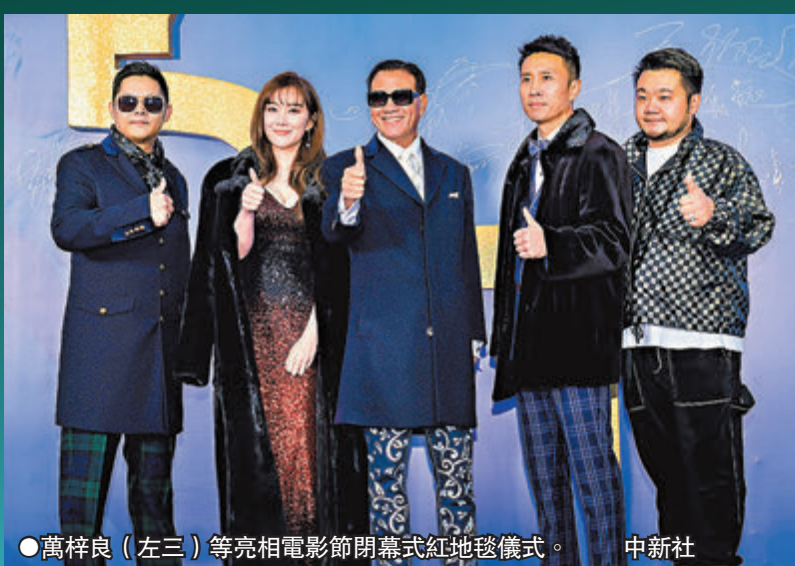
●萬梓良(左三)等亮相電影節閉幕式紅地毯儀式。中新社