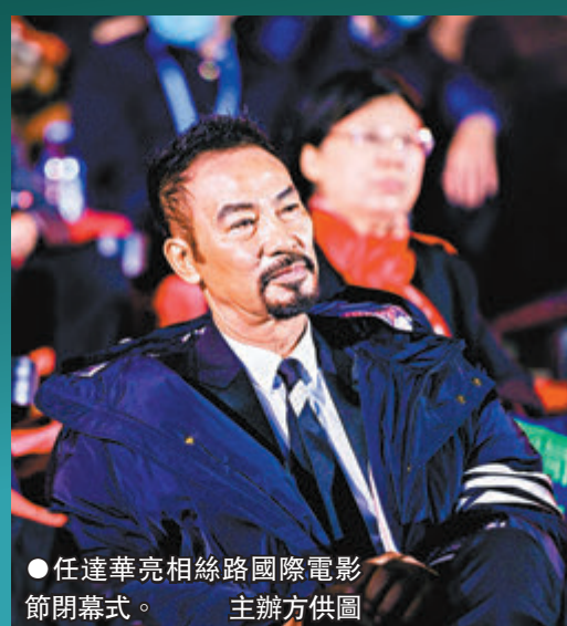
●任達華亮相絲綢之路國際電影節閉幕式。