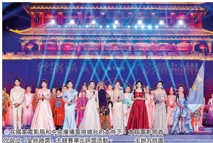
●在國家電影局和中央廣播電視總台的支持下，本屆電影節首次設立「金絲路獎」主競賽單元評獎活動。