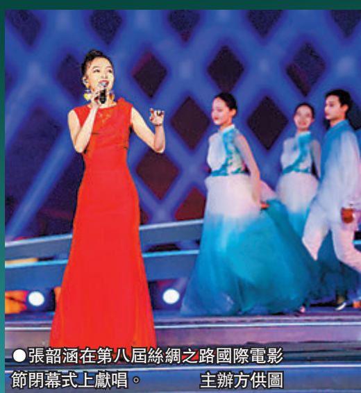
●張韶涵在第八屆絲綢之路國際電影節閉幕式上獻唱。