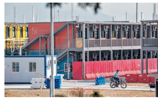
●新增Omicron個案的男病人，前天在竹篙灣檢疫中心確診。圖為竹篙灣檢疫中心。資料圖片 家樂、12月8日中午12時至下午2時曾到荃灣麗城薈建中一康健醫務中心，12月12日中午12時至下午1時曾到荃灣千色匯。

根據強制檢測公告詳情，該名外傭曾到荃灣多處地方，包括12月12日曾到荃灣昌耀大廈1樓大