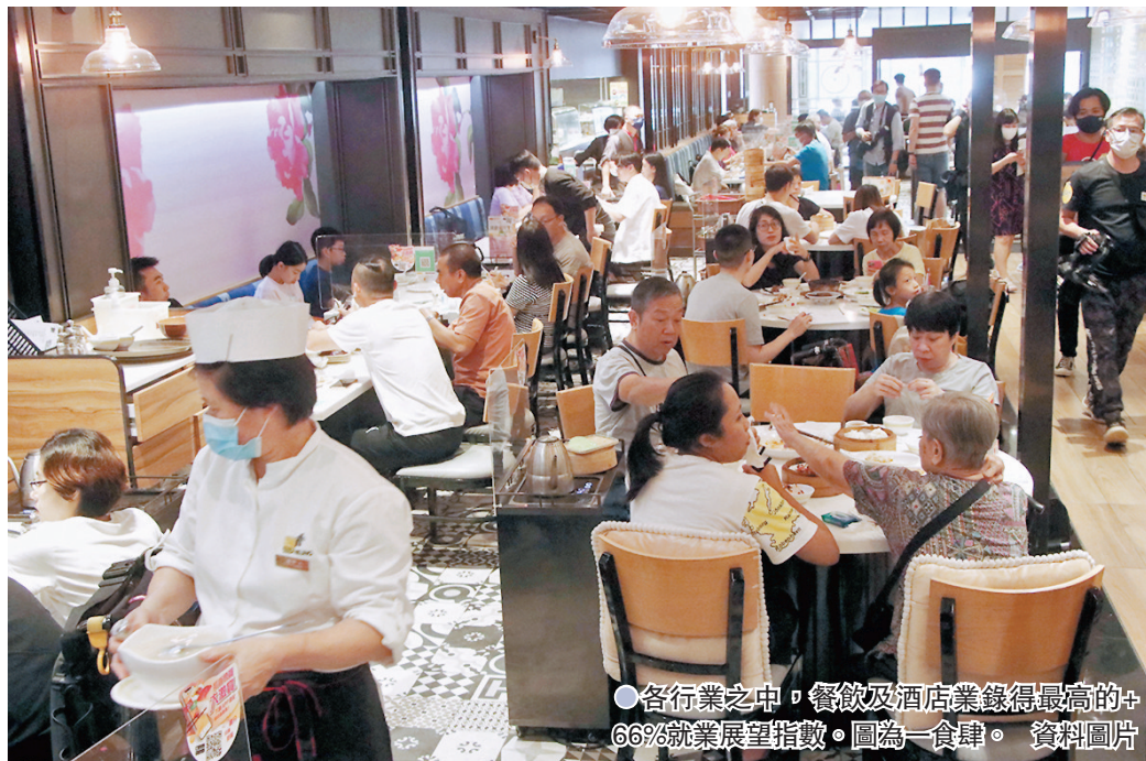
●各行業之中，餐飲及酒店業錄得最高的+66%就業展望指數。圖為一食肆。資料圖片

各行業中，明年第一季餐飲及酒店業錄得最高的+66%就業展望指數，資訊科技及通訊媒體業亦錄得較樂觀的+58%就業展望指數。徐玉珊指出，香港本地感染病例減少及疫苗接種率相對較高，社交距離措施正在逐步有序地放寬和研究進一步恢復正常通關，「社會期待內地與香港恢復免檢疫通行，疫情穩定刺激餐廳及酒店業僱主的招聘意慾。」她說，各行業恢復實