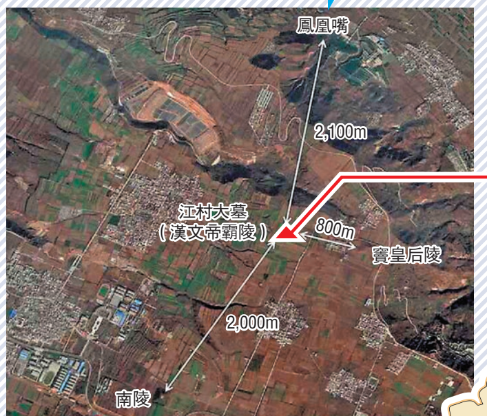
江村大墓與鳳凰嘴、南陵及竇皇后陵位置關係