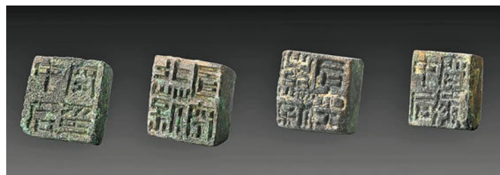
江村大墓K27外藏坑出土一組印章。