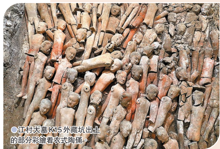
江村大墓K15外藏坑出土的部分彩繪着衣式陶俑。

在中國古書《二十四孝》中,有一則著名的「親嘗湯藥」典故,其中的主人公就是文帝劉恒和母親薄太后。在此次考古確定霸陵位置後,考古工作者發現,其母親薄太后的南陵,距離真正的霸陵僅2,000米。生前母慈子孝,身後母子相依相存,讓人動容。