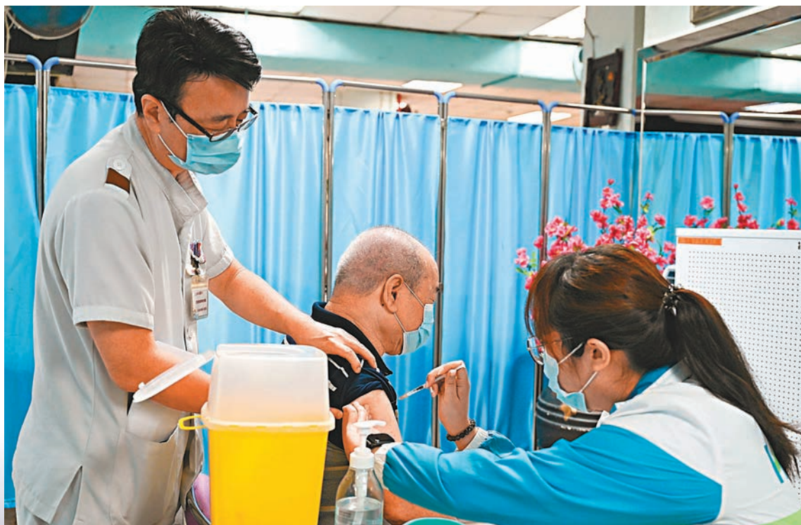
●專家呼籲已接種科興疫苗的市民盡快打第三針。圖為一名院友接種科興疫苗。 資料圖片

科興早前從香港獲得兩株 Omicron 病毒株，轉入中國醫學科學院醫學實驗動物研究所 P3 實驗室開展研究。隨後就其中一株 Omicron 病毒株，與已注射兩針及三針科興疫苗人士的血清樣本進行中和抗體試驗。研究結果顯示，20份接種兩針科興疫苗的血清樣本中，7人的血清出現中和抗體，比率為35%；而48份接種三針科興疫苗的血清，中和抗體陽性率高達94%。至於另一株 Omicron 病毒株的對比檢測正在進行中。 上述結果表明，第三劑新冠疫苗的接種能有效提高血清對 Omicron 病毒株的中和能力。科興團隊表示，正在對更多免疫後時間點及不同抗體水平的血清進行進一步的研究，以獲得 Omicron 病毒株對疫苗影響的全面評價。