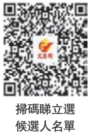
掃碼聯立選候選人名單

雖然選委會界別候選人的選民為選委，但各候選人並無輕視廣大市民的意見與聲音。同為民建聯成員的選委會界別29號候選人陳仲尼、34號候選人林琳、36號候選人葛珮帆、37號候選人郭玲麗、41號候選人陳凱榮、46號候選人張國鈞昨日中午到中環街頭擺設街站，宣傳立法會選舉投票日的資訊。