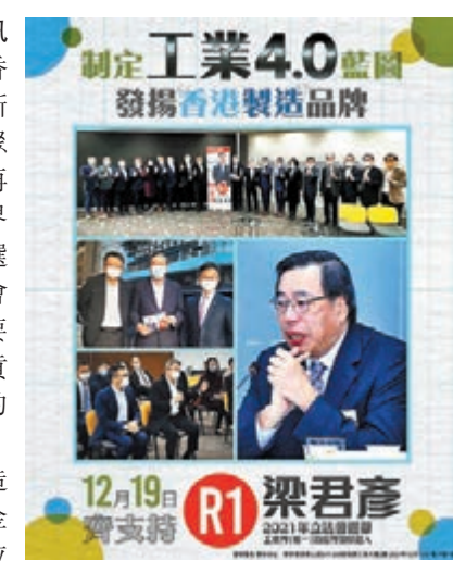
●梁君彥提出訂立明確的「工業4.0」策略。

香港的工業界希望新選制下香港可以聚焦發展，推動「再工業化」。工業界(第一)R1號候選人、第六屆立法會主席梁君彥提出要讓社會正視工業貢獻，訂立明確的「工業4.0」策略，發展高增值製造業，調高資助金額，設計應用學位課程培訓人才等；R2號候選人、香港鞋業總會主席梁日昌建議促進產學研合作，發展低碳生產，共建灣區標準架構，設立「一帶一路」共享試產基地等。