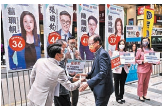
●民建聯6名立法會選委會界別候選人在中環擺設街站。