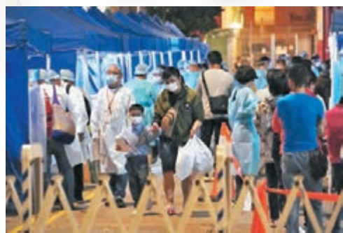
●祥興大廈居民須接受強制檢測。

特區政府在疫情期間先後推出兩輪防疫抗疫基金支援港澳跨境船東，以每艘船給予補貼，分別補貼船東每艘船100萬元及50萬元，但未有任何措施支援海運前線員工，工會指出，其他行業的前線員工都有不同程度的補貼，前線海員卻缺乏政府的資助。工會曾於施政報告諮詢會時向特區政府行政官林鄭月娥反映有關情況，特區政府當時亦承認基金的確遺漏了對前線海員的支援，並會好好研究相關措施，但至今仍未有兌現，工會促請特區政府盡快落實支援前線海員的措施。