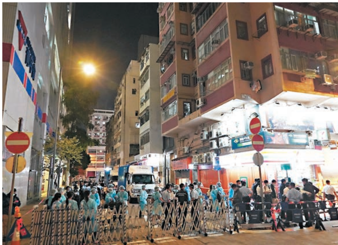
◀ 特區政府人員昨晚圍封強檢祥興大廈，並將男機師於潛伏期在港到訪的地點納入強制檢測公告。