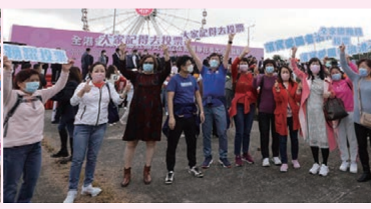
▲「全港省級同鄉社團支持立法會選舉花車大巡遊啟動禮」活動現場。