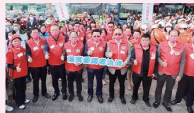
▲香港海南社團總會首長與鄉親呼籲市民踴躍投票。