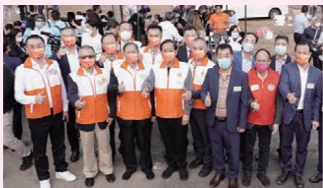
▲香港福建社團聯合會首長與鄉親呼籲市民踴躍投票。