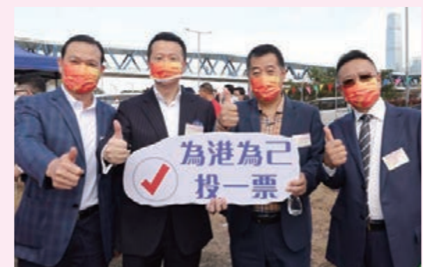
▲香港廣西社團總會首長與鄉親呼籲市民踴躍投票。