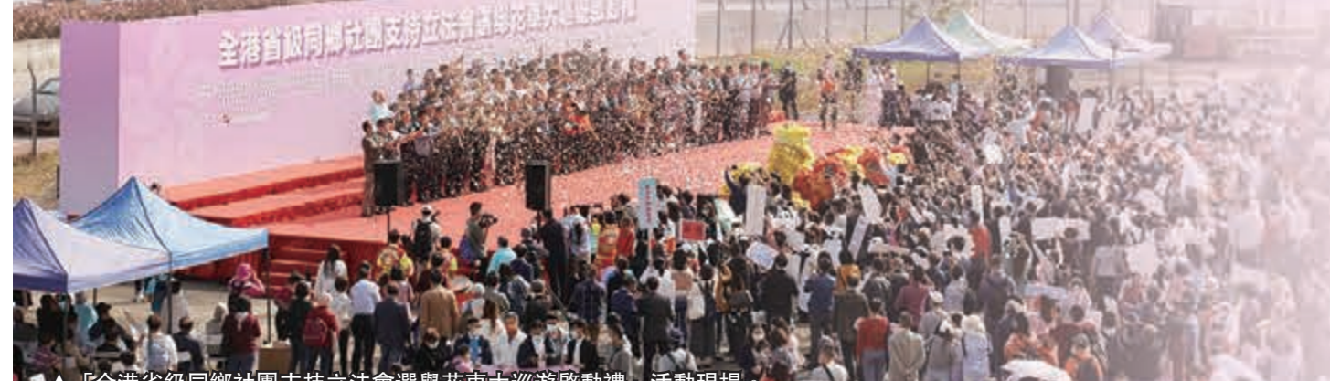
▲「全港省級同鄉社團支持立法會選舉花車大巡遊啟動禮」活動現場。