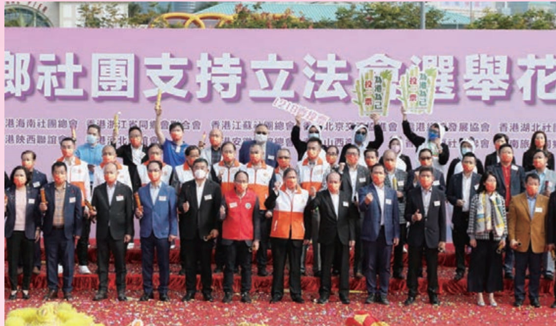
▲主禮嘉賓拉響禮炮，啟動「花車大巡遊」儀式。