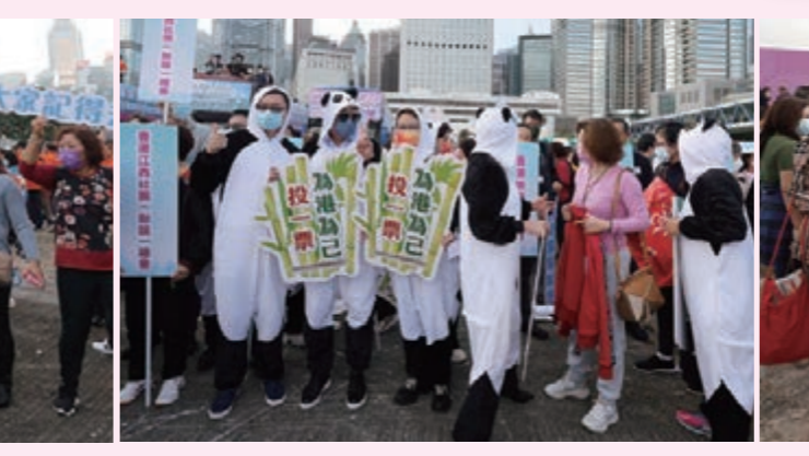
▲「全港省級同鄉社團支持立法會選舉花車大巡遊啟動禮」活動現場。