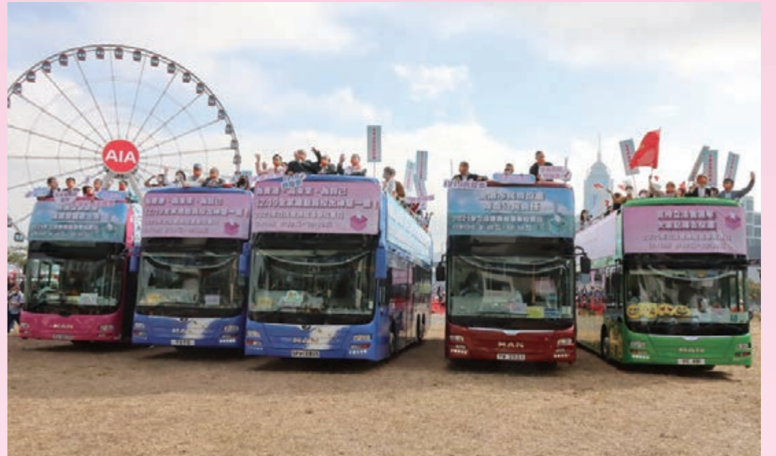
▲五輛開蓬巴士帶頭分五路巡遊港九新界，呼籲市民投票。