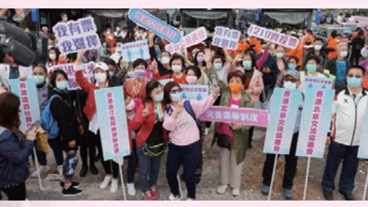
▲「全港省級同鄉社團支持立法會選舉花車大巡遊啟動禮」活動現場。