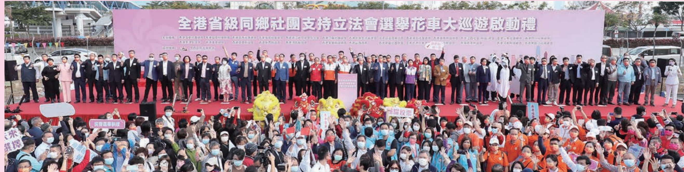
▲「全港省級同鄉社團支持立法會選舉花車大巡遊啟動禮」活動現場大合照。