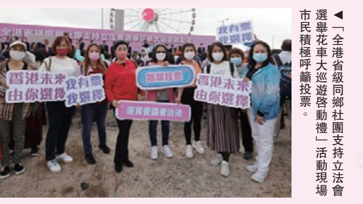
▲「全港省級同鄉社團支持立法會選舉花車大巡遊啟動禮」活動現場。