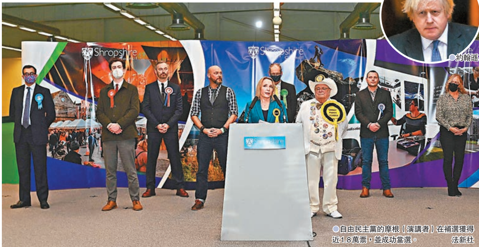
●自由民主黨的摩根(演講者)在補選獲得近1.8萬票，並成功當選。