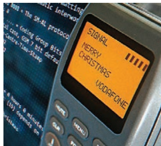
●短訊只有短短15個字符「MERRY CHRISTMAS」。 網上圖片