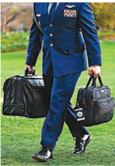
●手持「核足球」的職員伴隨美國總統身邊。