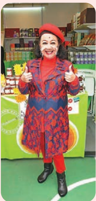
●71歲的薛家燕仍然好有精力。