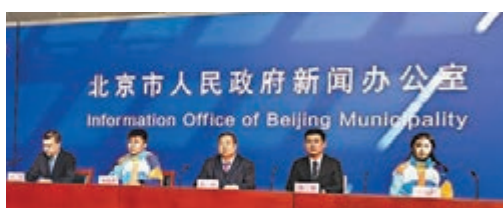
● 冬奧會和冬殘奧會系列發布會昨在京舉行。

香港文匯報訊(記者 馬曉芳北京報導)記者從17日舉行的2022年冬奧會和冬殘奧會北京主辦城市系列新聞發布會——城市志願者專場獲悉,將有20萬人次城市志願者在758個點位服務北京冬奧,提供人員引導、信息諮詢、語言服務、環境保障、助殘等服務,志願者們預計於2022年1月25日開始全面上崗。