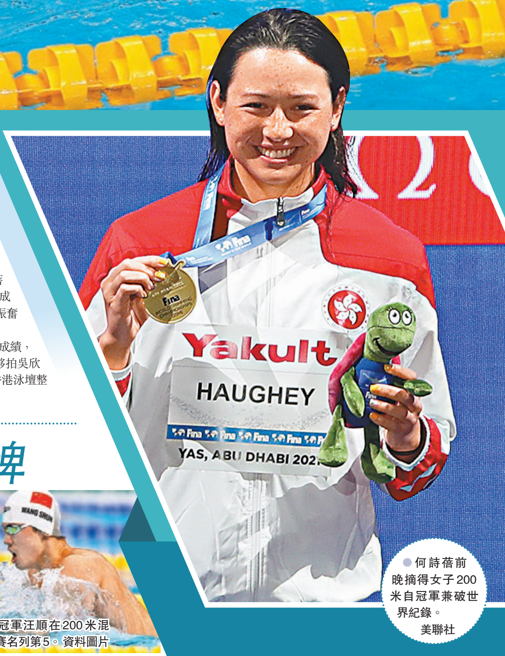
● 何詩蓓前晚摘得女子200米自冠軍兼破世界紀錄。