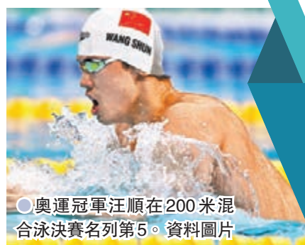
● 奧運冠軍汪順在200米混合泳決賽名列第5。