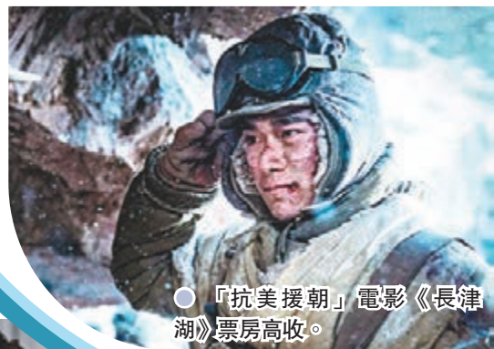
●「抗美援朝」電影《長津湖》票房高收。