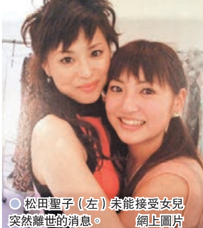
●松田聖子（左）未能接受女兒突然離世的消息。