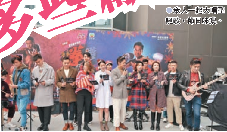
● 眾人一起大唱聖誕歌,節目味濃。