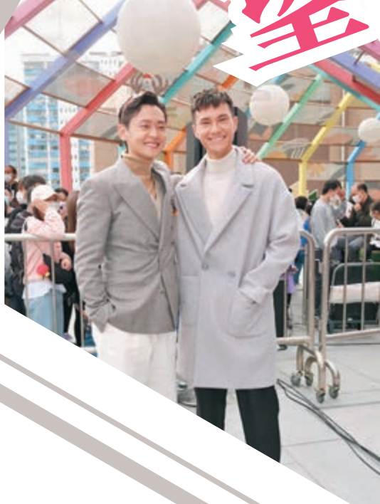
● 朱敏瀚(右)跟張振朗私底下一樣老友鬼鬼。