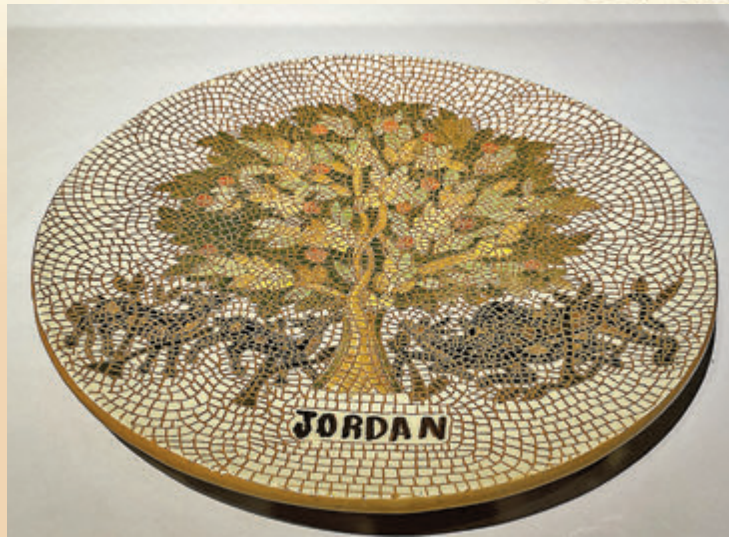
● 約旦非遺馬賽克鑲嵌畫。