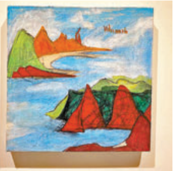
● 2021年創作的《那地方(二十二)》