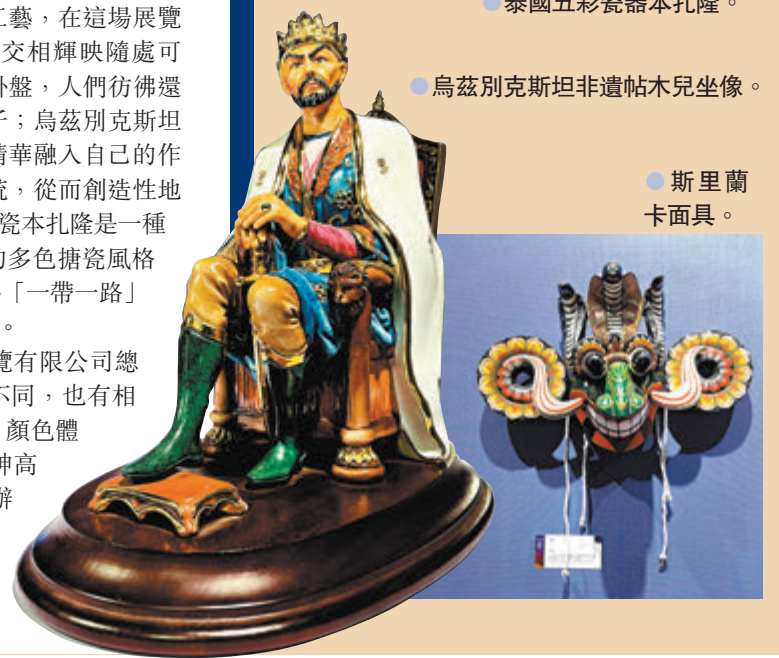
● 烏茲別克斯坦非遺帖木兒坐像。