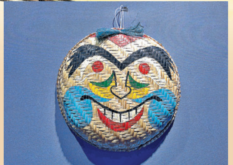
● 越南非遺竹編面具。