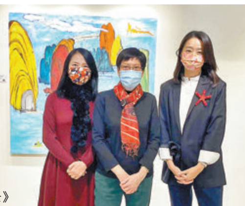
● 《無名風景》系列作品