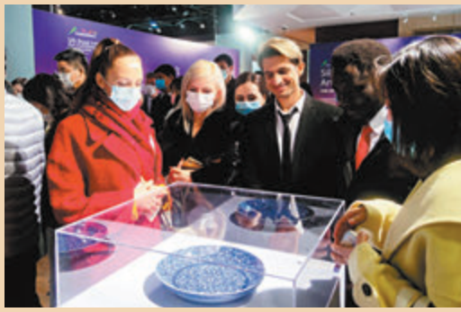
● 展覽吸引了眾多在西安的國際友人參觀。