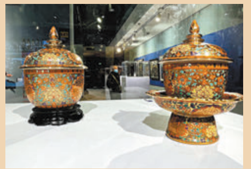
● 泰國五彩瓷器本扎隆。