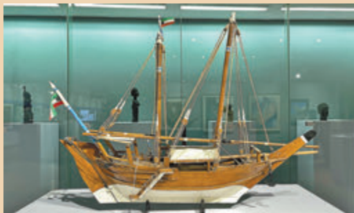
● 現場展出的科威特雙桅木帆船模型。