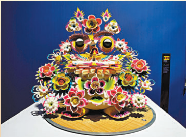
● 中國非物質文化遺產面花。