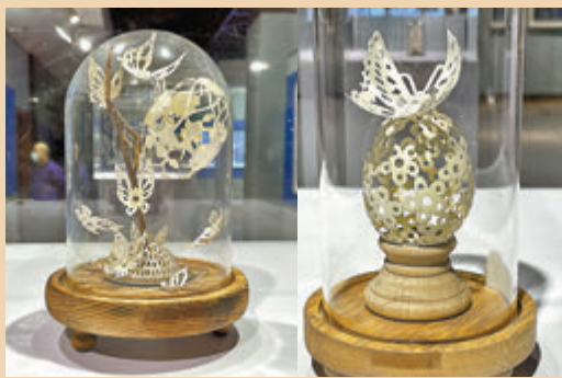
● 科威特精美蛋雕作品。