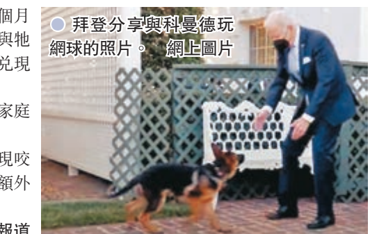
拜登分享與科曼德玩網球的照片。

尚普於今年6月過世，梅傑則因不適應白宮生活出現咬人事件，於3月被送回拜登位於特拉華州的老家接受額外訓練，目前仍未返回白宮。