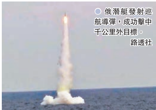
俄潛艇發射巡航導彈，成功擊中千里外目標。

據塔斯社報道，636.3型柴電潛艇由俄羅斯「紅寶石」海軍裝備中央設計局研發，屬基洛級改進型第三代常規潛艇，於2019年11月25日交付。該型潛艇長74米、寬9.9米，潛航排水量超過3,900噸。「口徑」巡航導彈是俄羅斯較為先進的巡航導彈，可從海上對敵方陸海目標進行精準打擊。 ●綜合報道