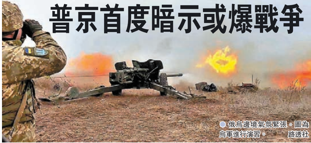
俄烏邊境氣氛緊張。圖為烏軍進行演習。

俄羅斯總統普京昨日警告，俄國準備採取軍事和技術措施，來回應西方就烏克蘭衝突的「不友善」行為，是普京首次暗示烏克蘭危機可能引發戰爭。