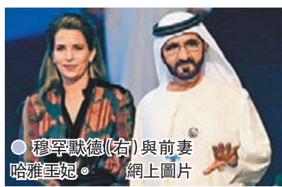
穆罕默德(右)與前妻哈雅王妃。

1,100萬英鎊(約1.1億港元)的贍養費和子女保安費用，合共2.9億英鎊(約30億港元)。穆罕默德亦需另外支付300萬英鎊(約3,100萬港元)的子女教育費用和960萬英鎊(約9,921萬港元)的贍養費欠款。 ●綜合報道