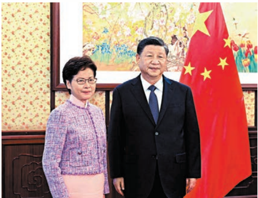
● 習近平主席與林鄭月娥在會見前合照。

香港文匯報訊 綜合本報記者馬靜及新華社報道，國家主席習近平昨日下午在中南海瀛台會見來京述職的香港特別行政區行政長官林鄭月娥，聽取她對香港當前形勢和特別行政區政府工作情況的匯報。