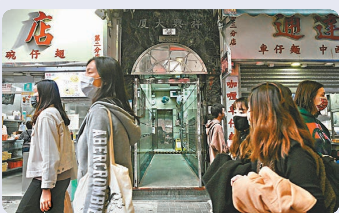
●政府在納入強制檢測公告的油麻地祥興大廈採取執法行動，檢查逾百人的檢測報告，其中7人違反強制檢測公告。圖為油麻地祥興大廈。

對於特區政府及醫管局收緊員工的檢測規定，以及在轄下設施實施「疫苗氣泡」，醫學會傳染病顧問委員會聯席主席曾祈殷昨日在電台節目中指出，Omicron疫情來得很急，接種疫苗已經是大勢所趨，認為政府做法是希望起示範作用，無可厚非。 他認為，Omicron變種病毒株在全球快速傳播，本港的風險也隨之增加，政府不得不收緊外防輸入措施，又建議政府可考慮減少檢疫酒店入住人數，減低病毒傳播風險。「環球充斥Omicron變種病毒株，香港面對風險一定增加。政府應考慮，現時指定檢疫酒店入住的旅客數量是否需要收緊？例如每層樓入住人數減少，以及加強消毒及抽風，會令到受感染機會減低。」