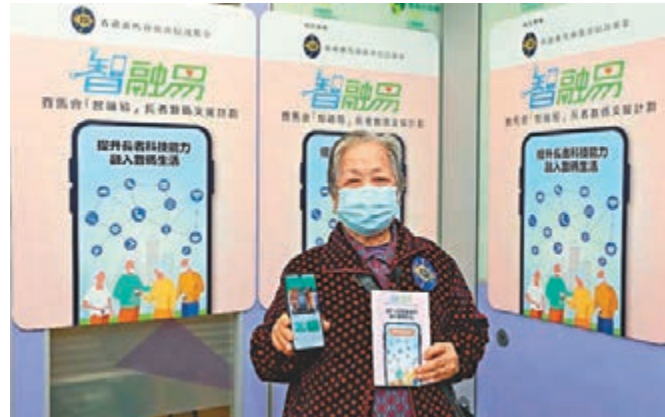
●香港賽馬會透過其慈善信託基金撥捐2,700萬元，向合共兩萬名基層長者派發支援「安心出行」的智能手機。中移動供圖

香港文匯報訊（記者 文森）香港賽馬會透過其慈善信託基金撥捐2,700萬元，推行賽馬會「智融易」長者數碼支援計劃，透過12間社福機構及4間本地流動通訊網絡商，向合共兩萬名基層長者派發支援「安心出行」的智能手機，以及12個月免費流動通訊網絡服務，其中中國移動香港會提供逾5,000部不同品牌的智能手機，並安排專業人員為指定長者地區中心員工提供培訓，協助長者掌握使用智能手機及相關應用程式的方法及技巧。 參與計劃之一的中國移動香港董事兼行政總裁李帆風表示，他們一直致力透過業務所